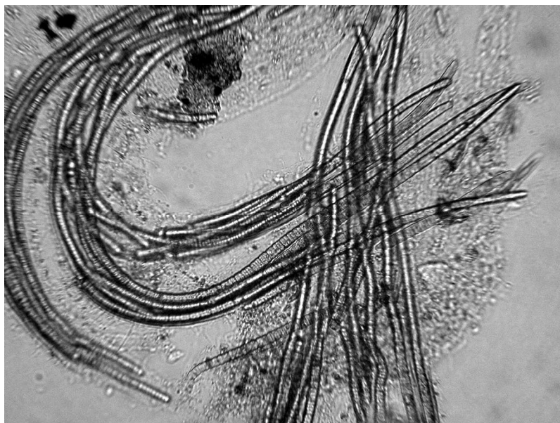
Рис. 1. Desmonema wrangelii (Ag.) Born et Flah.