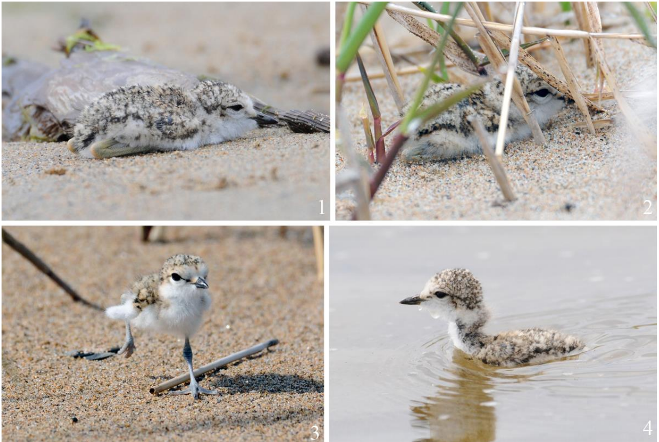
Рис. 15. Некоторые варианты поведения пуховых птенцов морского зуйки Charadrius alexandrinus при опасности. Юго-западное побережье залива Петра Великого между устьем реки Туманная и мысом Островок Фальшивый, 17 мая 2014, фото Д.В.Коробова