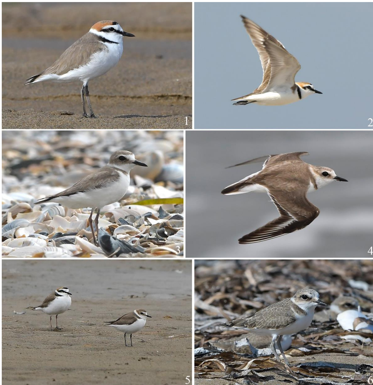
Рис. 1. Морской зюёк Charadrius alexandrinus . 1 – самец, побережье залива Петра Великого к северу от устья реки Туманная, 6 мая 2023; 2 – самец, залив Посъета, коса Назимова, 7 мая 2023; 3 – самка, там же, 23 июня 2023; 4 – самка, там же, 23 июня 2023; 5 – самец (слева) и самка (справа), побережье залива Петра Великого к северу от устья реки Туманная, 20 мая 2023; 6 – молодой, залив Посъета, коса Назимова, 27 июля 2023.

устье реки Шмидтовка (рис. 2.8) (Горчаков 1990; материалы Зоомузея ДВФУ); в заливе Восток (рис. 2.9) (Нечаев 2014), в бухтах Петрова (рис. 2.10), Кит (рис. 2.11) (Шохрин 2017) и Джигит (рис. 2.12) (Елсуков 2013); на морском побережье в окрестностях посёлка Терней (рис. 2.13) (Елсуков 2013); в окрестностях села Самарга (рис. 2.14) (Елсуков 2013).