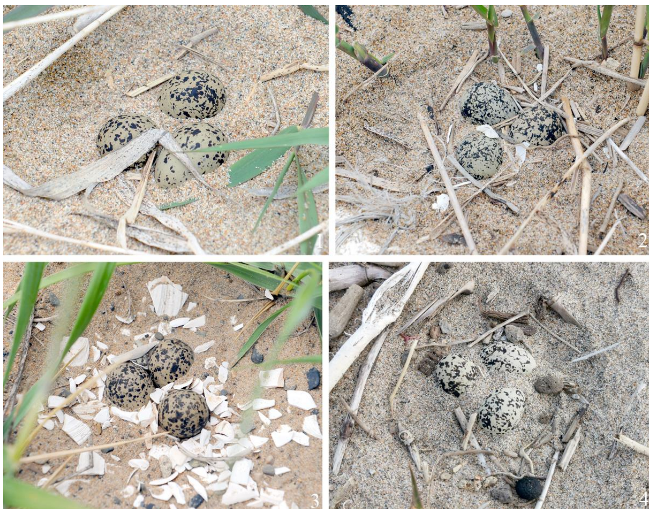
Рис. 9. Кладки морского зуйка Charadrius alexandrinus , яйца которых частично засыпаны песком. 1, 2 – юго-западное побережье залива Петра Великого между устьем реки Туманная и мысом Островок Фальшивый, 24 мая 2014; 3 – побережье залива Посьета, коса Назимова, 6 июня 2016; 4 – юго-западное побережье залива Петра Великого между устьем реки Туманная и мысом Островок Фальшивый, 7 мая 2023.

Яйца кладки, обнаруженной Г.А.Горчаковым (1990) 4 мая 1987 на вспаханном поле в устье реки Шмидтовка, были на четверть присыпаны пылевидным грунтом. В нашем случае яйца 4 из осмотренных насиженных кладок, оказались частично засыпанными песком (рис. 9).