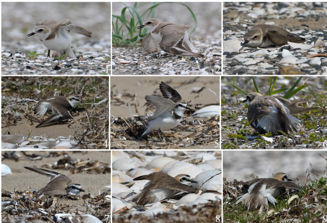
Рис. 14. Морские зуйки Charadrius alexandrinus , отводящие наблюдателя от нелётных птенцов, притворяясь ранеными. 1,2 – юго-западное побережье залива Петра Великого между устьем реки Туманная и мысом Островок Фальшивый, 6 июня 2016; 3-9 – побережье залива Посьета, коса Назимова, 7 мая 2023.