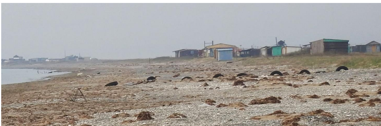
Рис. 20. Район застройки типичных местообитаний морских зуйков базами отдыха. Побережье залива Посьета, коса Назимова. 25 апреля 2023.

Активное развитие пляжного туризма, имеющее место на побережьях Южного Приморья, затрагивает практически все основные места гнездования морских зуйков. Наиболее опасным для них является плотная застройка песчаных побережий базами отдыха (рис. 20), поскольку в таком случае кулики покидают прежние места размножения, что сокращает пригодные для их гнездования участки, поступательно снижая численность размножающейся в Приморье группировки.