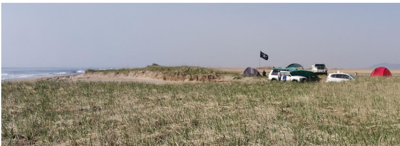
Рис. 21. Временная палаточная стоянка туристов в месте размножения морских зуйков, организованная в период разгара их гнездового сезона. Юго-западное побережье залива Петра Великого между устьем реки Туманная и мысом Островок Фальшивый. 7 мая 2023.

Те участки песчаного побережья, где туристические базы ещё не выстроены, занимают представители неорганизованного туризма, формирующие временные палаточные стоянки. В таких местах наибольший