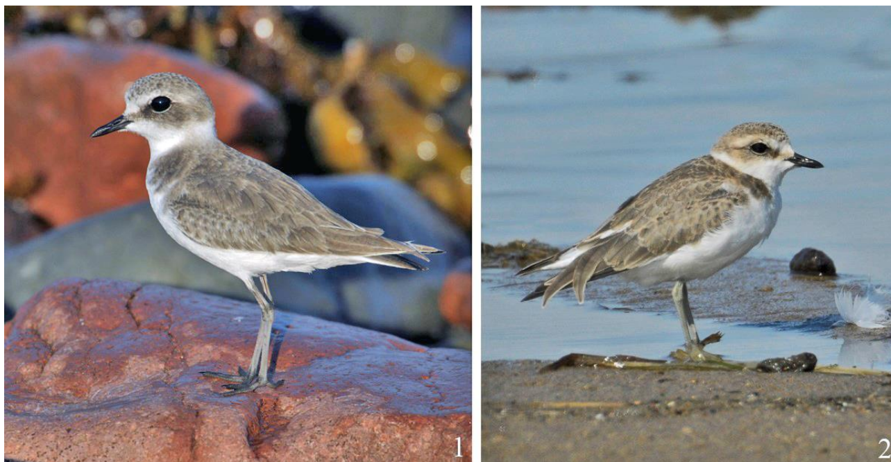
Рис. 19. Морские зуйки Charadrius alexandrinus во время осеннего пролёта. 1 – залив Петра Великого, остров Попова, 18 сентября 2008; 2 – юго-западное побережье залива Петра Великого между устьем реки Туманная и мысом Островок Фальшивый, 21 августа 2008.

Приморья, между Голубиным Утёсом и мысом Островок Фальшивый, самая поздняя встреча морских зуйков зарегистрирована 26 сентября 1976 (Глущенко 1988).