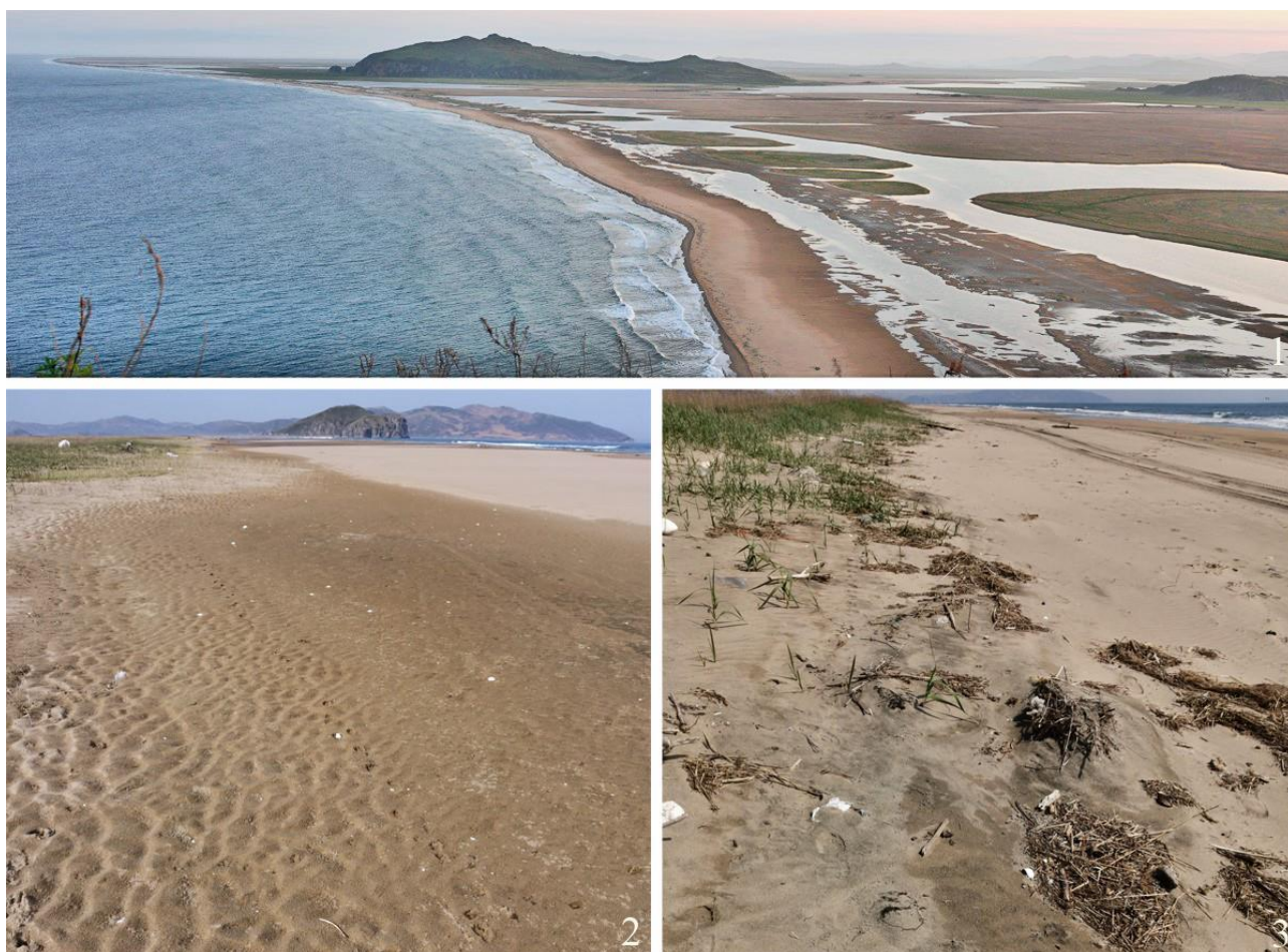
Рис. 3. Варианты гнездовых биотопов морского зуйка Charadrius alexandrinus на юго-западном побережье залива Петра Великого между устьем реки Туманная и мысом Островок Фальшивый: 1 – 22 мая 2014; 2 – 6 мая 2023; 3 – 7 мая 2023.

Еврейской автономной области (Аверин 2010). Для Хабаровского края известна единственная встреча одиночного залётного первогодка, произошедшая на острове Байдукова (стык Амурского лимана и Сахалинского залива) 9 августа 2022 (Глущенко и др. 2023). Подвидовую принадлежность последнего из указанных экземпляров, а, соответственно, и приблизительное место его рождения, установить невозможно. Возникает резонный вопрос: откуда происходят птицы, многократно встреченные на Ханкайско-Раздольненской равнине? Можно лишь предположить, что существует ещё не найденная гнездящаяся группировка морского зуйка, населяющая бассейн реки Амур, хотя ближайшим известным местом летних встреч этого зуйка на материке является Восточное Забайкалье (Иванов 2021).