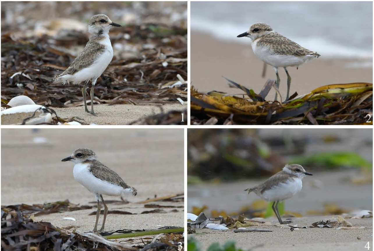
Рис. 16. Лётные молодые морские зуйки Charadrius alexandrinus . Побережье залива Посыета, коса Назимова: 1-3 – 10 июня 2023; 4 – 23 июня 2023.