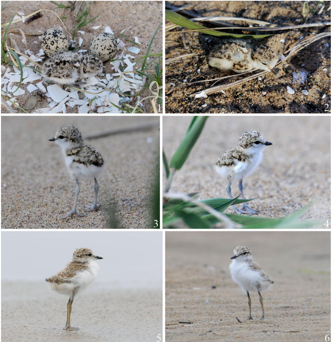
Рис. 12. Пуховые птенцы морского зуйка Charadrius alexandrinus . 1,2 – побережье залива Посьета, коса Назимова, 7 мая 2023; 3, 4 – юго-западное побережье залива Петра Великого между устьем реки Туманная и мысом Островок Фальшивый, 17 мая 2014; 5, 6 – там же, 22 мая 2014.

При посещении мест гнездования морских зуйков на косе Назимова 23 июня 2023 мы учли 8 взрослых и 8 молодых морских зуйков, как недавно поднявшихся на крыло (рис. 16.4), так и полностью выросших (рис. 17).