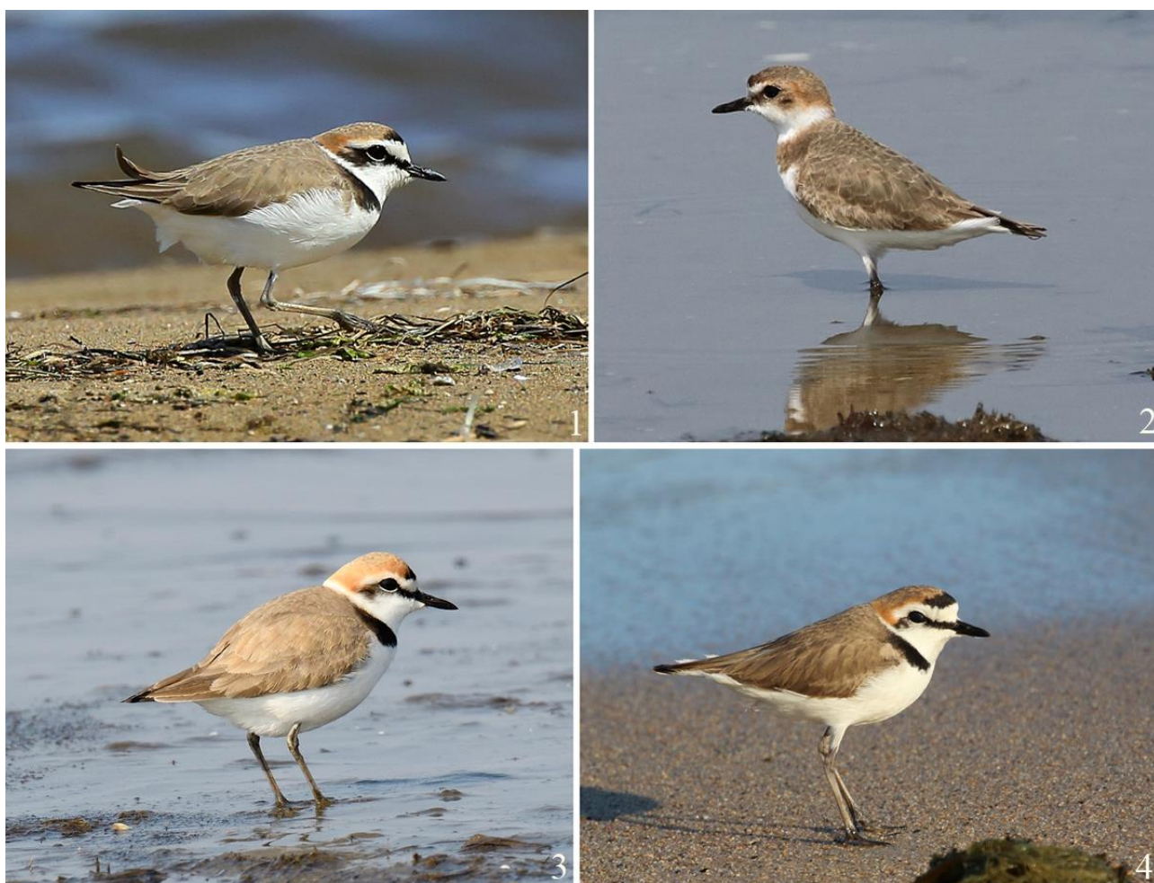
Рис. 5. Некоторые наиболее ранние пролётные морские зуйки Charadrius alexandrinus . 1 – побережье залива Находка, город Находка, 28 марта 2022; 2 – залив Петра Великого, остров Русский, 31 марта 2021; 3 – там же, 6 апреля 2019; 4 – бухта Петрова, 8 апреля 2015.