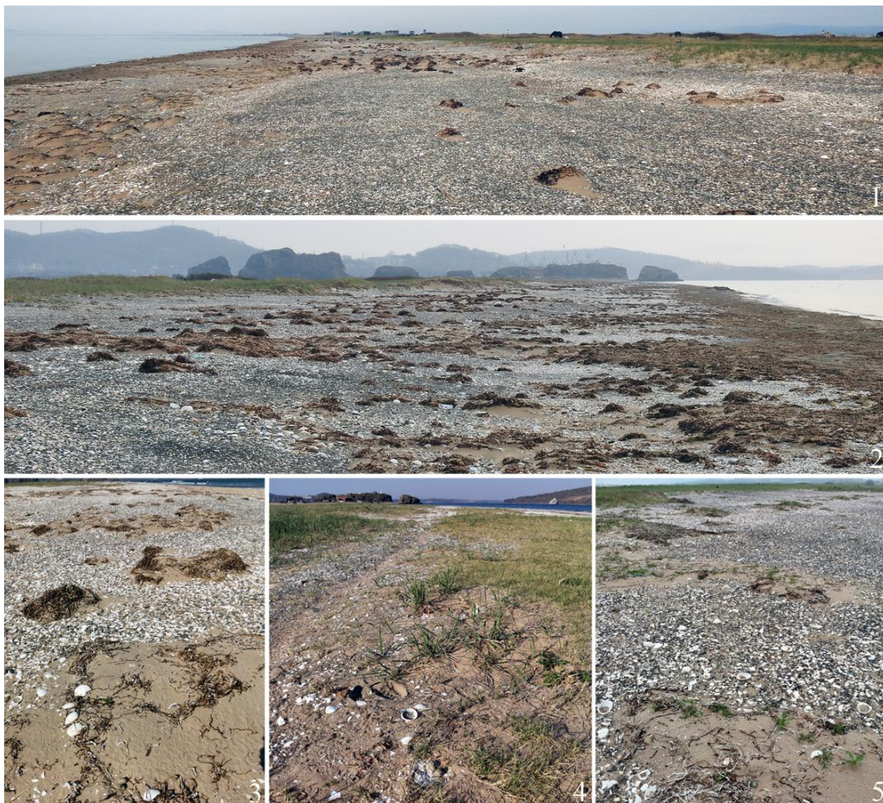
Рис. 4. Варианты гнездовых биотопов морского зуйка Charadrius alexandrinus на побережье залива Посыета, коса Назимова: 1, 2 – 25 апреля 2023; 3, 4 – 7 мая 2023, 5 – 10 июня 2023

лива) гнездо с 3 сильно насиженными яйцами нашли на вспаханном поле в 25 м от берега моря (Горчаков 1990). Ошибочное указание на расположение этого гнезда в 25 км от берега (Назаров 2004) является опечаткой.