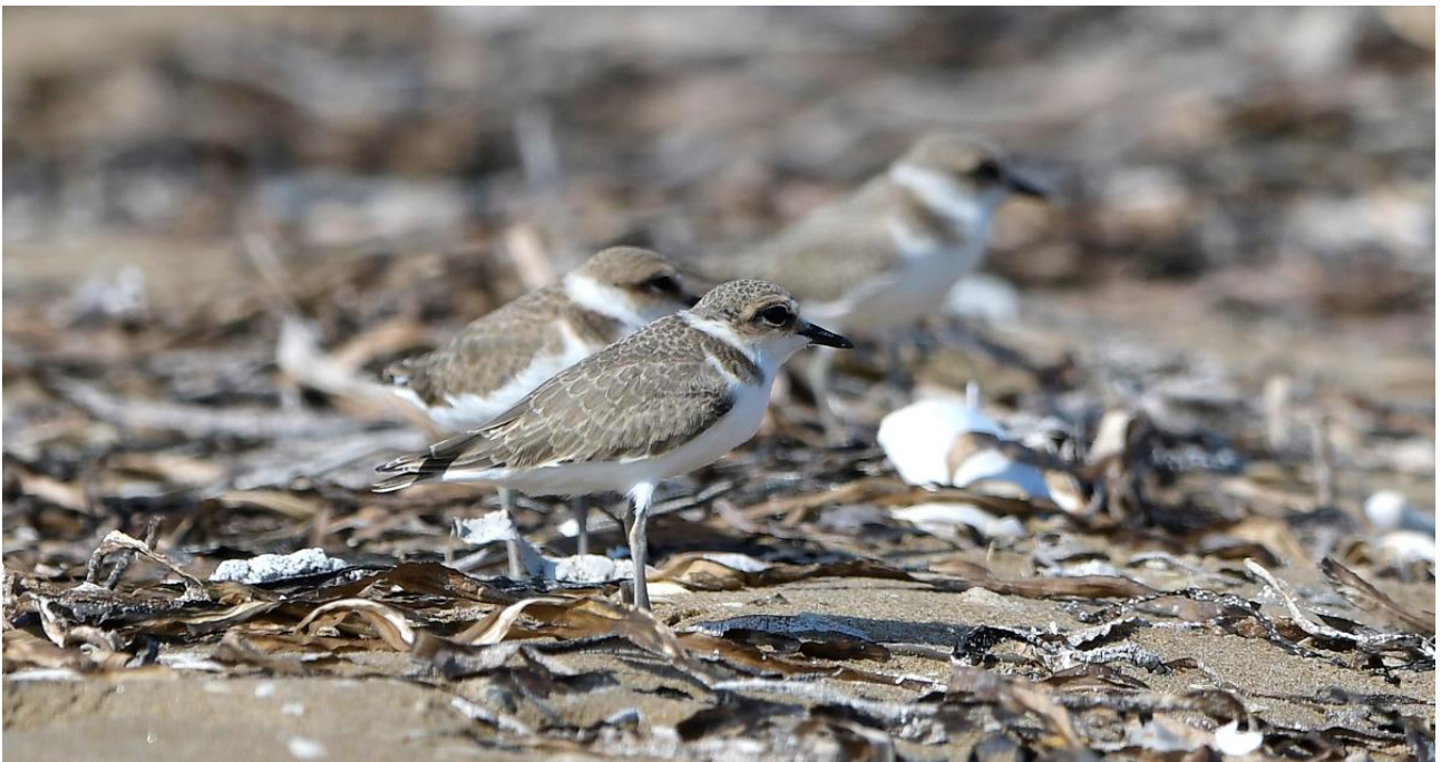
Рис. 18. Группа молодых морских зуйков Charadrius alexandrinus . Побережье залива Посьета, коса Назимова. 27 июля 2023.

Во время послегнездовых кочёвок и осенью в прибрежных районах Приморского края морских зуйков наблюдали сравнительно редко. На северо-востоке Приморья одиночных особей регистрировали 3 сентября 1975 в бухте Благодатная и 23 сентября 2001 на берегу моря у посёлка Терней (Елсуков 2013). На юго-востоке края, в бухте Просёлочная, одиночного морского зуйка отметили 1 августа 1946 (Воробьёв 1954); в бухте Киевка 3 птиц встретили 25 августа 1959 (Литвиненко, Шibaев 1971). В бухте Кит, в окрестностях села Глазковка, одиночных зуйков регистрировали 13 сентября 1991, 22 сентября 1992, 3 сентября 1994 и 11 сентября 2001. В бухте Петрова взрослую самку видели 20 августа 2013, взрослого самца – 21 августа 2013, а молодых птиц – 31 августа 2005, 1 сентября 2005 и 18 сентября 2014 (Шохрин 2017).