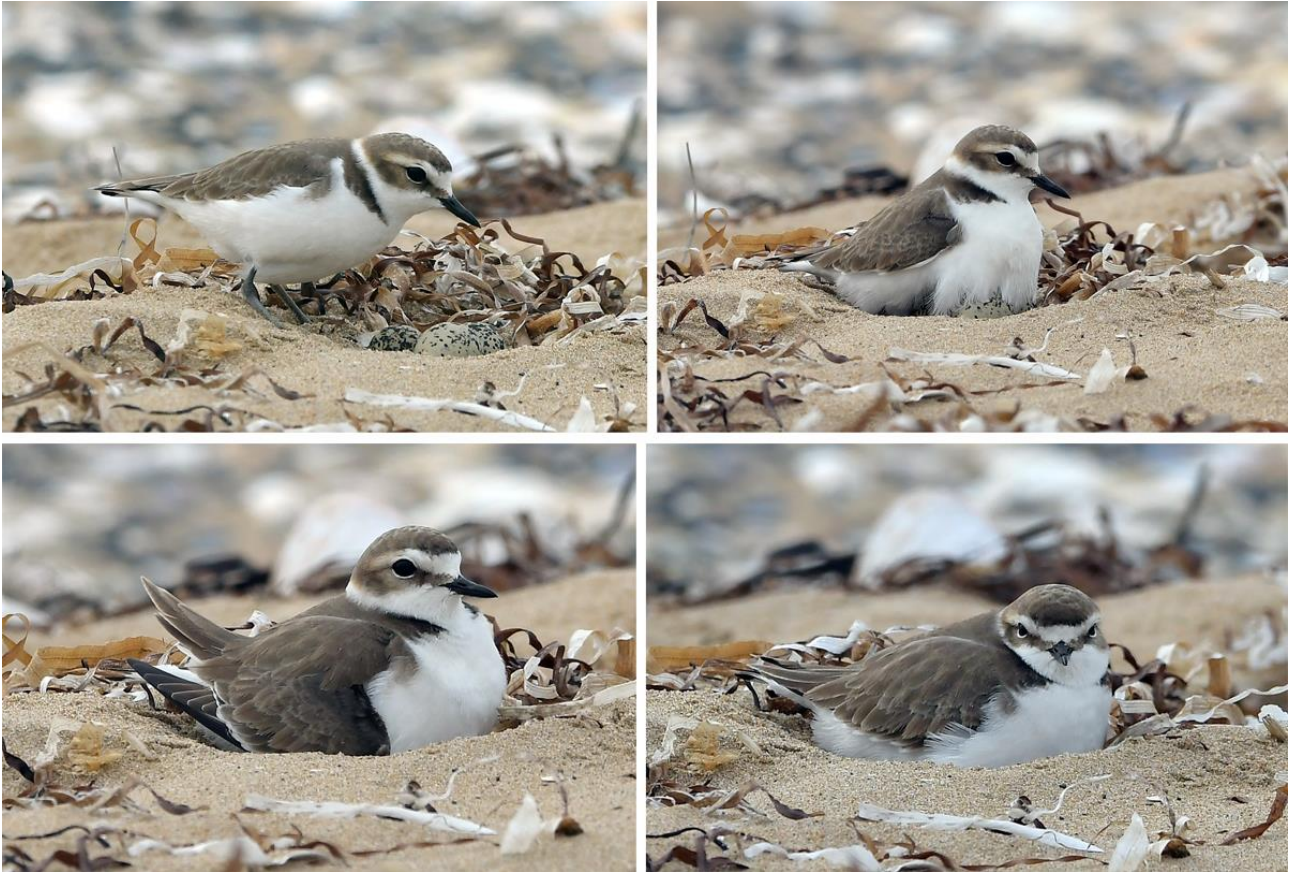
Рис. 10. Самка морского зуйка Charadrius alexandrinus , насиживающая кладку. Побережье залива Посьета, коса Назимова, 25 апреля 2023.