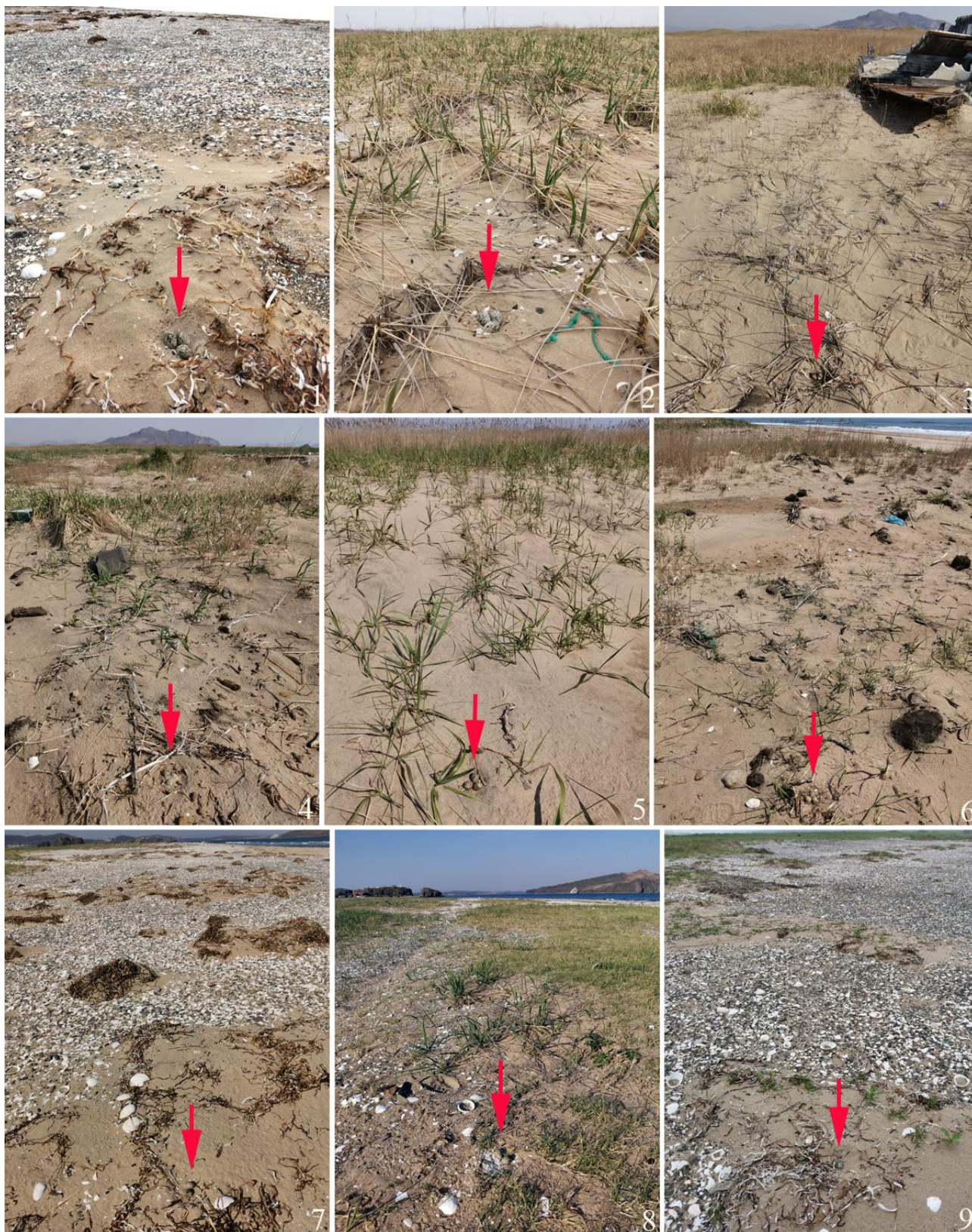
Рис. 7. Расположение гнёзд морского зуйка Charadrius alexandrinus (указано стрелками). 1, 2 – побережье залива Посьета, коса Назимова, 25 апреля 2023; 3-6 – юго-западное побережье залива Петра Великого между устьем реки Туманная и мысом Островок Фальшивый, 7 мая 2023; 7, 8 – побережье залива Посьета, коса Назимова, 7 мая 2023; 9 – там же, 10 июня 2023.

вовала, хотя в целом ряде случаев в гнездовой ямке присутствовали обрывки сухих водорослей, сухие травинки и плоские обломки раковин (рис. 8). Размеры гнёзд приведены в таблице 3.