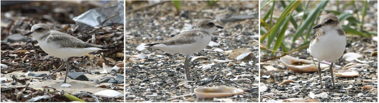
Рис. 17. Молодые самостоятельные морские зуйки Charadrius alexandrinus . Побережье залива Посьета, коса Назимова. 23 июня 2023.