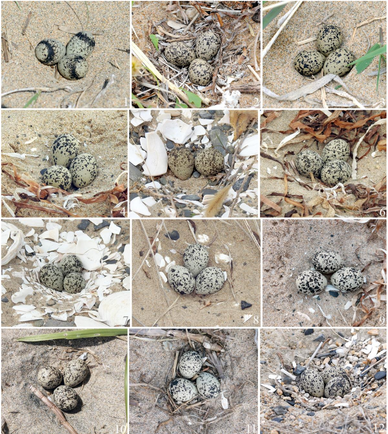
Рис. 8. Полные кладки морского зуйка Charadrius alexandrinus . 1 – юго-западное побережье залива Петра Великого между устьем реки Туманная и мысом Островок Фальшивый, 17 мая 2014; 2 – там же, 19 мая 2014; 3 – там же, 24 мая 2014, фото Д.В.Коробова; 4-8 – побережье залива Посыета, коса Назимова, 25 апреля 2023, фото Ю.Н.Глущенко; 9 – там же, 25 апреля 2023; 10, 11 – юго-западное побережье залива Петра Великого между устьем реки Туманная и мысом Островок Фальшивый, 7 мая 2023, фото Д.В.Коробова; 12 – залив Петра Великого, бухта Бойсмана, 1 мая 2018, фото А.В.Вялкова.

Гнёзда с сильно насиженными кладками, найденные Е.Н.Пановым (1973) 29 мая (год не указан) в устье реки Барабашевка и Г.А.Горчаковым (1990) 4 мая 1987 в устье реки Шмидтовка, содержали по 3 яйца. В 7 гнёздах, информация о которых приведена Ю.Н.Назаровым с соавторами (1996), было по 3 яйца, в 1 – 2 яйца, в 3 – по 1 яйцу. Однако не