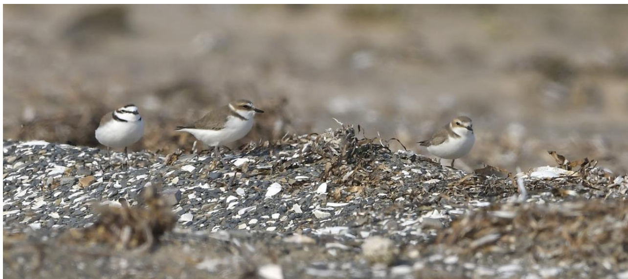
Рис. 6. Группа морских зуйков Charadrius alexandrinus из гнездящейся группировки. Побережье залива Посьета, коса Назимова, 24 апреля 2023.