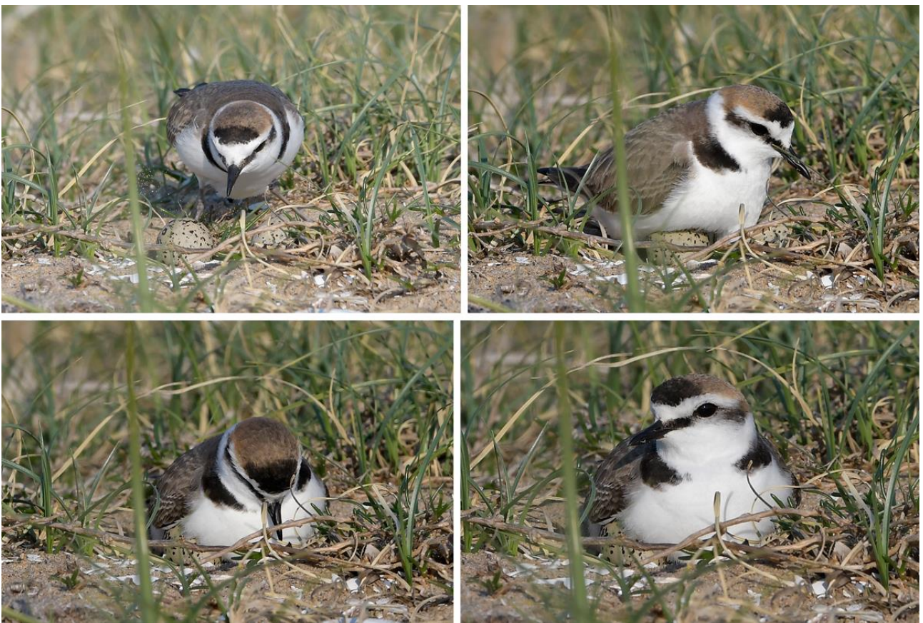
Рис. 11. Самец морского зуйка Charadrius alexandrinus , насиживающий кладку. Побережье залива Посьета, коса Назимова, 7 мая 2023.