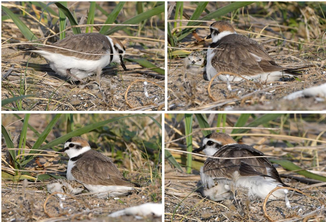
Рис. 13. Самец морского зуйка Charadrius alexandrinus , согревающий пуховых птенцов. Побережье залива Посьета, коса Назимова, 7 мая 2023.