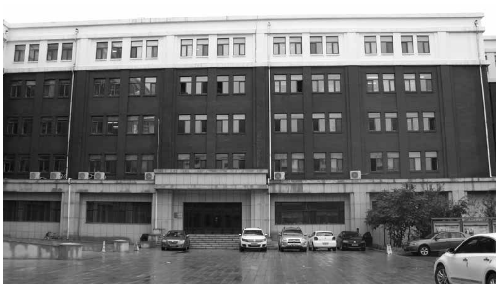
Рис. 1. Здание Института изучения особых животных и растений Китайской АСХН

Важное направление исследований в ISAPS – виноградарство и виноделие, а также изучение ягодных растений и их селекция на основе использования ресурсов дикой флоры. По инициативе сотрудников института, поддержанной Департаментом науки и техники провинции Цзилинь, было решено провести совместную научную китайско-российскую конференцию для обмена информацией о результатах исследований и опытом, полученным в обеих странах. Она была посвящена развитию промышленного разведения диких плодовых растений и разработке технологий производства вина из сортов, полученных на основе винограда амурского, эндемичного вида дальневосточной арборифлоры. В работе конференции приняли участие 50 чел., в том числе 13 российских ученых из разных российских регионов и научно-исследовательских организаций: Всероссийского национального научно-исследовательского института виноградарства и виноделия «Магарач» РАН (ВНИИ ВиВ, Ялта), ВНИИ ВиВ им. Я.И. Потапенко (Новочеркасск),