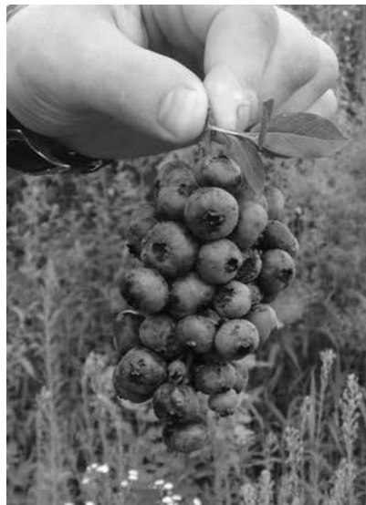
Рис. 11. Урожай на плантации голубики собран в конце июля, но на кустах остались единичные кисти, дающие представление о сорте