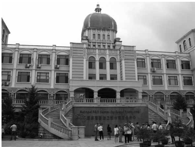
Рис. 4. Филиал Национального научно-технического центра виноделия (уезд Люйхе) был первым предприятием, которое мы посетили