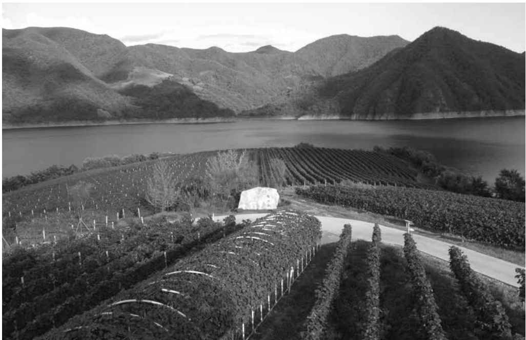
Рис. 7. Плантации «Яцянгу» содержатся в идеальном порядке. Междуядья застилаются укрывным материалом или обрабатываются гербицидами

Ликер «Ялу» и шесть видов виноградного вина, выпускаемые винозаводом «Тунтань», завоевали награды разного достоинства в Китае и за рубежом. Красные ледяные вина «Хуанпиюа» из сорта Бей Бин Хун и «Тонтиноное позднего сбора урожая» («Tontine Late Harvest Shuanghong, Vitis amurensis – 2012») из винограда амурского получили золотые медали на Международном конкурсе натуральных вин в 2017 и 2018 гг. Второе считается лучшим в серии ледяных вин. Вот как оно описывается: «Цвет этого вина глубокий рубиново-красный. Аромат вина наполнен нотами мелких ягод, спелых диких фруктов и дуба. Особый