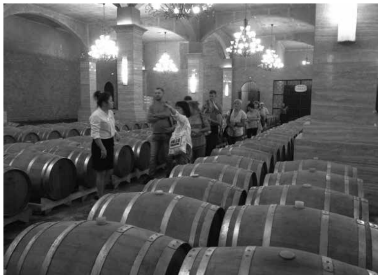
Рис. 5. Хранилище вина под музеем амурского винограда. В хранилища компании «Тунтань» ежегодно закладывается до 20 тыс. т виноградного сока для производства вина

В завершение обзора сообщений по винограду следует перечислить основные задачи и перспективы развития виноградарства в Китае, вытекающие из результатов исследований и обозначенные на конференции: 1) сохранение ресурсов дикого винограда, устойчивого к болезням и воздействию неблагоприятных факторов, 2) увеличение площадей возделывания наиболее продуктивных сортов с обоеполями цветками и высокой сахаристостью плодов, 3) селекция и сохранение сортов с высокой морозоустойчивостью, поиск маркеров морозоустойчивости, 4) определение и оценка факторов, обеспечивающих высокое качество продукции и снижение ее себестоимости.