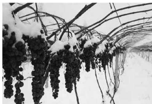
Рис. 10. После наступления устойчивых заморозков плоды Бей Бин Хуна готовы для приготовления ледяного вина. Их собирают вручную после выпадения снега.