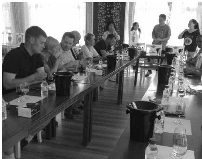
Рис. 9. Дегустация разных сортов ледяного вина, вырабатываемых в ООО «Яцзянгу»

сорта со всего мира – 4120 сортов, которые можно и следует использовать для ускоренного распространения в России.