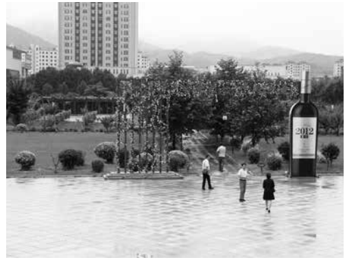
Рис. 6. Музей амурского винограда (а) и его визитная карточка (б) – бутылка красного ледяного вина « Vitis amurensis – 2012» в г. Тунхуа. Музей посещают до 250 тыс. чел. в год