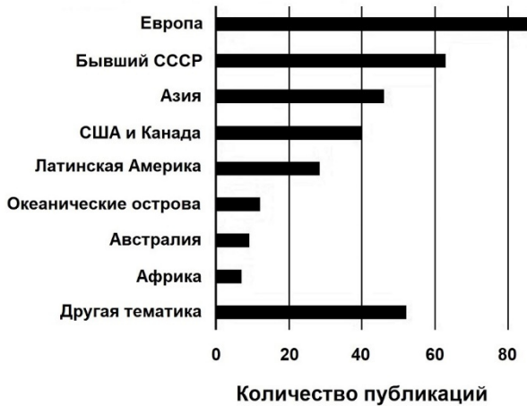
Рис. 2. Распределение публикаций по регионам исследований