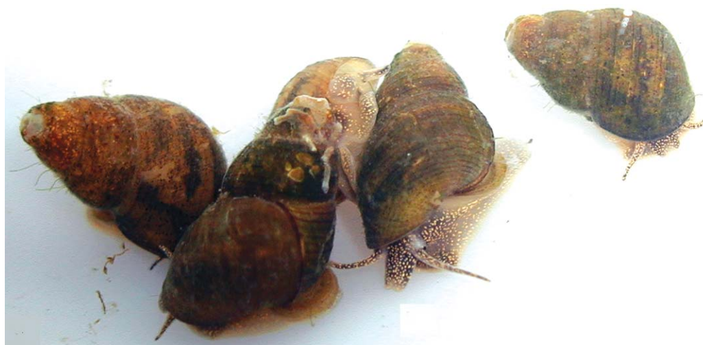
Рис. 1. Живые особи Parafossarulus spiridonovi из поймы р. Илистая (Приморский край).