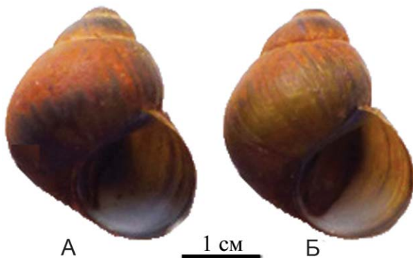
Рис. 2. Некорродированные взрослые раковины двух видов живородок рода Amuropaludina из р. Бира (ЕАО): А – A. chloantha , Б – A. praerosa.

Разрушение верхних оборотов скрадывает не только половые, но и видовые особенности морфологии раковин Amuropaludinidae. В отличие от крупных раковин Amuropaludina , обычно имеющих корродированные верхние обороты, у среднеразмерных представителей рода межвидовые различия в форме раковин гораздо заметнее, что видно на примере одновозрастных A. chloantha (рис. 2 А) и A. praerosa из р. Бира (ЕАО) (рис. 2 Б).