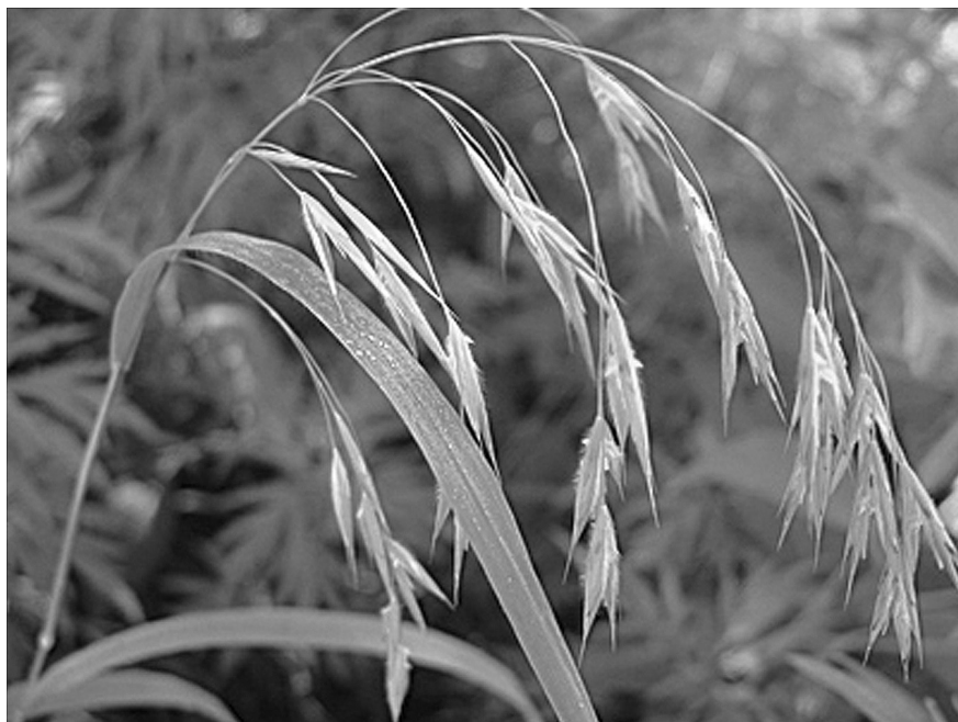
Рис. 1. Bromopsis ciliata . Курильские о-ва, о. Шикотан, бухта Горобец. [ Bromopsis ciliata . The Kurils, Shikotan Island, Gorobetz Bay.].

ший из культуры) Bromopsis inermis ; на юге РДВ он даже натурализовался в Амурской обл., Хабаровском и Приморском краях, на Сахалине, проник и на Южные Курилы (о. Кунашир). B. inermis – очень полиморфный, еще недостаточно изученный вид, известны несколько его разновидностей. В Сибирь (как и на РДВ) этот вид, по мнению Н.Н. Цвелёва, был занесен или интродуцирован в качестве кормового растения. Заслуживает более глубокого дополнительного изучения.