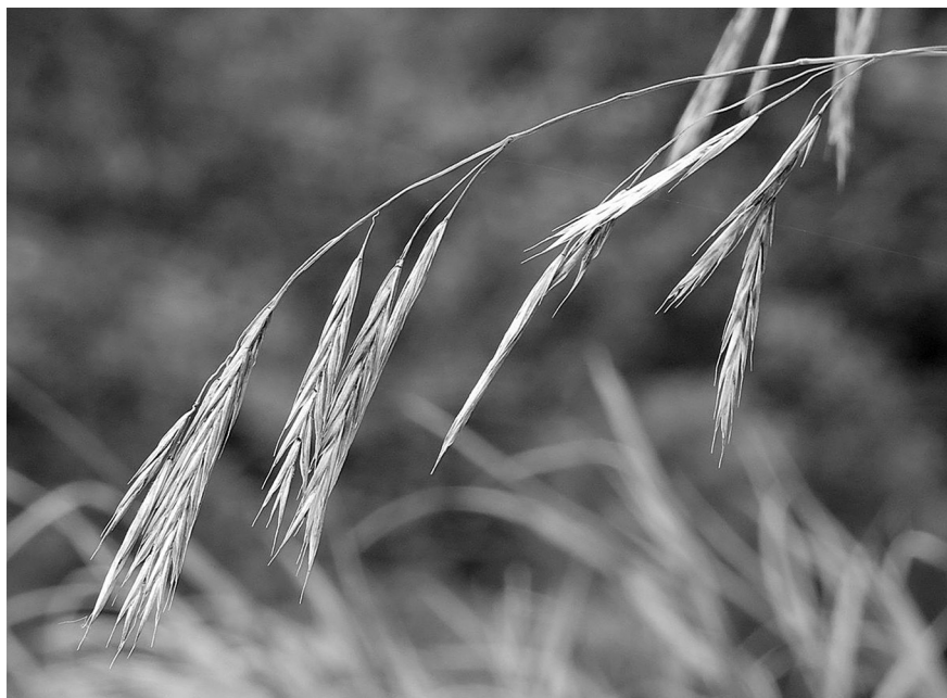
Рис. 3. Bromopsis probatovae . Приморский край, Партизанский р-н, гора Сенькина Шапка. [ Bromopsis probatovae from the mountain Sen'kina Shapka, Partizanskii District, Primorskii Territory.]

ное. Из Макаровского р-на близ Заозерного ранее уже был описан ряд таксонов злаков (из родов Poa , Calamagrostis , Agrostis ), установленных в разное время Н.Н. Цвелёвым и нами.