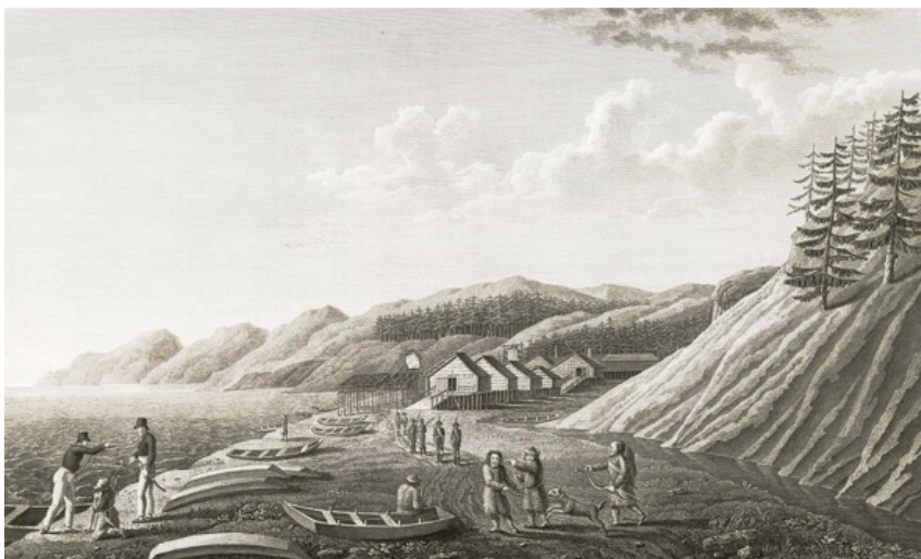
Вид зал. Надежды. Сев. Сахалин. Рис. Вильгельма Готлиба Тилезиуса фон Тиленау. Из: (Крузенштерн 1813, б, л. 83).

что мы не имеем ни малейшаго против их неприязненного намерения, в доказательство чего снял с себя ипагу. Сверх того обнадежил я, что мы не пойдем в их дома, а только посмотрим на оные в близости» [Там же, с. 186].