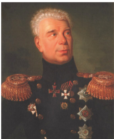
Портрет И. Ф. Крузенштерна. Художник Я. Ф. Гревизир- ский. Вторая половина XIX в. Центральный военно-морской музей, СПб.