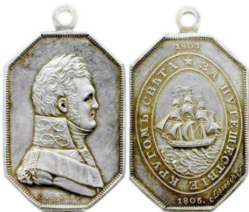
Наградная медаль «За путешествие кругом света в 1803–1806 гг.

открытиями и сведениями о малоизвестных странах и территориях. Впервые выполнены широкие океанографические и метеорологические работы. Государь в память об этом важном событии даже приказал выбить особую медаль. Наградная медаль «За путешествие кругом света в 1803–1806 гг.» – государственная награда Российской империи, которой награждались моряки, участвовавшие в кругосветной экспедиции И. Ф. Крузенштерна и Ю. Ф. Лисянского. Медаль была учреждена Александром I 15 августа 1806 г. На лицевой стороне изображен портрет Александра I в мундире Преображенского полка.