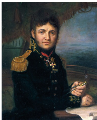
Портрет Ю. Ф. Лисянского. Художник В. Л. Боровиковский. 1810 г. Центральный Военно- исторический музей артиллерии, инженерных войск и войск связи, СПб.

стремилось всегда мое желание, меня подкрепляла; надежда совершить путешествие счастливо ободряла дух мой, и я начал всемерно пеюся о приготовлениях в путь, неиспытанный до того Россиянами» (Крузенштерн 1809, с. XXV).