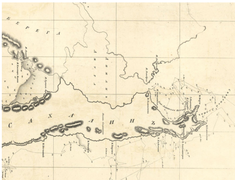
Часть карты Северного Сахалина. Составлена И. Ф. Крузенштерном. Из: (Крузенштерн 1826, б, с. 36).