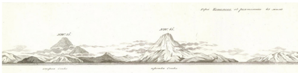
Гора Кошелева (в центре). Фрагмент рисунка из: (Крузенштерн 1813, а, л. 8).

Крузенштерн сетовал, что ему не хватило времени для обследования Шантарских о-вов, так как «опись Сахалина задержала меня более нежели я ожидал; сверх того я был обязан уважить и то, что нам надлежало придти в Кантон в начале ноября...» [Там же] для встречи с Лисянским. Таким образом, в начале августа 1805 г. мореплаватель поспешил на Камчатку, где ему для ремонта шлюпа и пополнения запасов предстояло пробыть еще 4 или 5 недель. Крузенштерн, тем не менее, отмечал: «Но чтобы плавание наше не было совсем бесполезным для Географии, то и вознамерился я при сем случае определить некоторые места западного Камчатского берега..., полагая что оный неопределён еще астрономическими наблюдениями» [Там же, с. 205]. Из-за туманов и штормов попытка завершить описание западной Камчатки оказалось невозможным, в то же время по пути к Петропавловску Крузенштерн серьезно уточнил координаты о-ва Иона (Охотское море), а также исследовал побережье Парамушира, где описал южный мыс, названный мысом Васильева 19 (первоначально назывался мысом графа Васильева), и один из наиболее высоких пиков юго-западной оконечности острова, названный пиком Фуса 20 – «именем известного в Российских ученых Академика» [Там же, с. 211]. Кроме того, Крузенштерном был открыт «высокий пик», расположенный на южной оконечности Камчатки и получивший название в честь правителя Камчатской области в 1803–1806 гг. Павла Ивановича Кошелева 21 [Там же, с. 213].