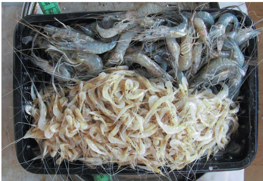
Рис. 3. Улов креветок Palaemon modestus (внизу) и Macrobrachium sp. (вверху)