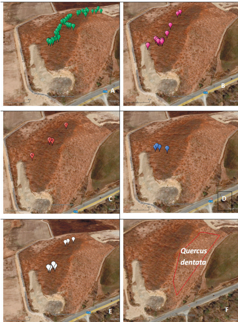
Рис. 3. Распределение на г. Малютка редких видов растений: Paeonia lactiflora (A); Cypripedium calceolus (B); C. macranthos (C); C. ventricosum (D); C. guttatum (E); Quercus dentata (F)]. [Fig. 3. Distribution of rare plant species on Malyutka Mount: Paeonia lactiflora (A); Cypripedium calceolus (B); C. macranthos (C); C. ventricosum (D); C. guttatum (E); Quercus dentata (F)].