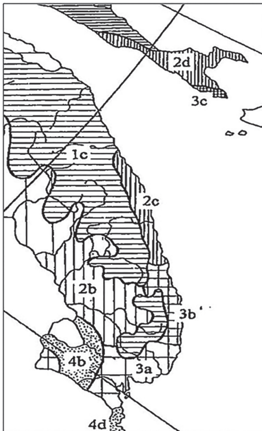
Рис. 2. Географическое районирование дубовых лесов (Приморский край). Здесь и в таблицах 2, 3 географические районы и подрайоны даны по А.П. Добрынину (2000): 1с – Сихотэ-Алинский подрайон (фация северных фрагментарных дубняков); 2а – Амуро-Уссурийский подрайон; 2б – Южно-Уссурийский подрайон; 2с – Тернейский прибрежный подрайон (фация типичных дубняков); 3а – Южно-Приморский подрайон; 3б – Ольгинско-Дальнегорский подрайон (фация южных дубовых лесов); 4б – Приханкайский район; 4д – Хасанский район (фация остепненных дубовых лесов).

[ Fig. 2. Geographical zoning of oak forests (Primorsky Krai). Here and in the Tables 2, 3 Geographic Regions and Sub-regions are given according A.P. Dobrynin (2000): 1c – Sikhote-Alin Sub-region (Northern fragmentary oak forests); 2a – Amur-Ussuri Sub-region; 2b – South-Ussuri Sub-region; 2c – Terney Coastal Sub-region (Typical oak forests); 3a – South-Primorye Sub-region; 3b – Olga-Dalneregorsk Sub-region (Southern oak forests); 4b – Prikhankaishkiy Region; 4d – Khasan Region (Steppe oak forests)].