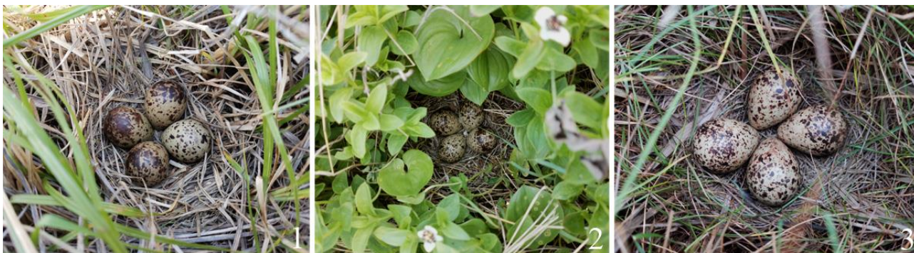
Рис. 22. Гнёзда травников Tringa totanus с кладками. Остров Байдукова, залив Счастья (Сахалинский залив). Июль 2022.