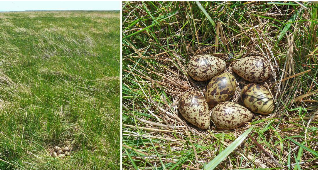
Рис. 17. Гнездо со смешанной кладкой, состоящей из 4 яиц травника Tringa totanus и 2 яиц камчатской крачки Sterna camtschatica . Северный Сахалин, Набильский залив, остров Чайка. 21 июня 2012.