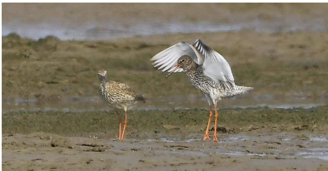
Рис. 23. Травники Tringa totanus , проявляющие элементы брачного поведения. Остров Байдукова, залив Счастья (Сахалинский залив). 2 июля 2022.