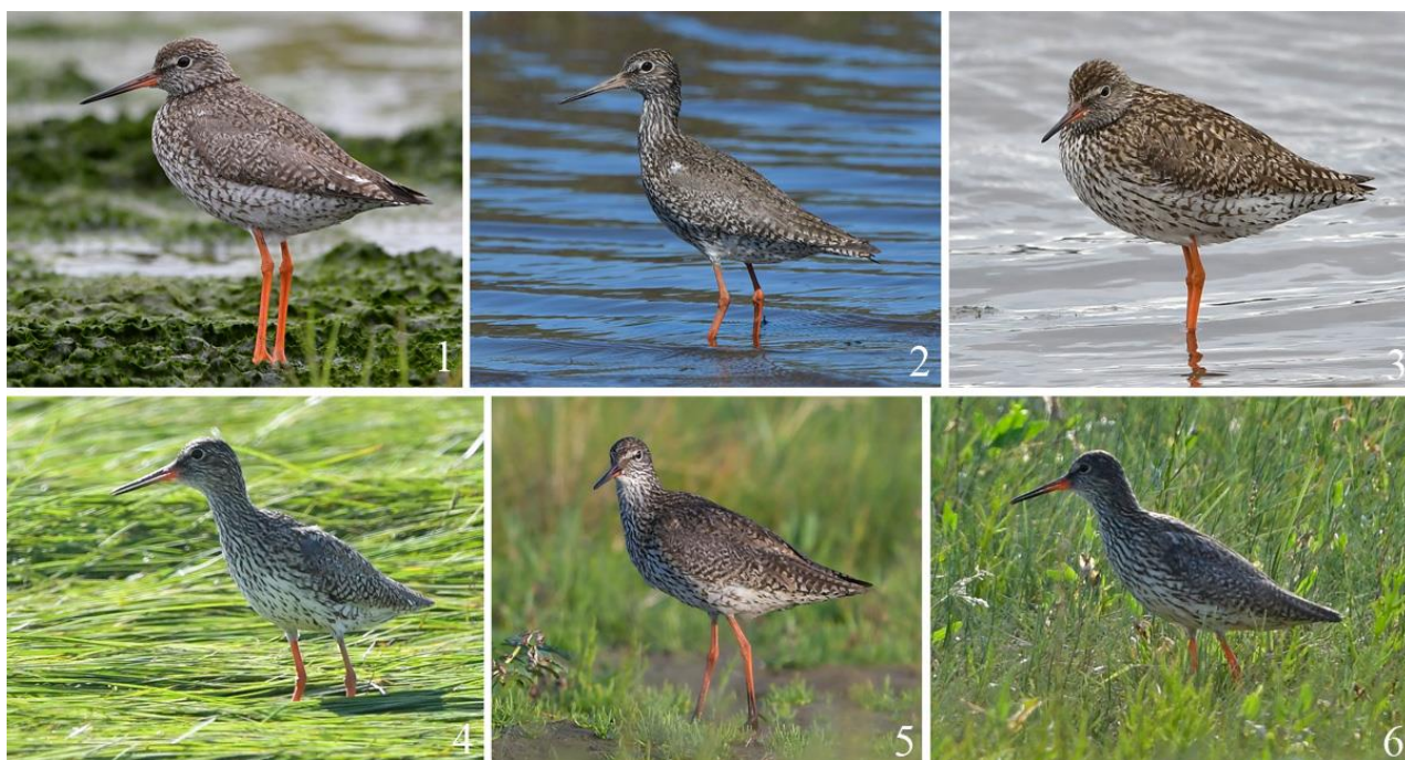
Рис. 2. Взрослые травники Tringa totanus в летнем наряде, Хабаровский край, остров Байдукова. 1 – 26 июля 2022; 2 – 28 июля 2022; 3 – 28 июля 2022; 4 – 30 июня 2022; 5 – 15 июля 2022; 6 – 19 июля 2022.

Распространение и численность. Согласно описанию Л.С.Степняна (2003), на гнездовании травник широко распространён в Евразии от атлантического до тихоокеанского побережья и Сахалина, при этом подвид T. t. ussuriensis занимает восточную часть гнездового ареала, лежащую к западу до Уральского хребта и долины реки Эмбы.