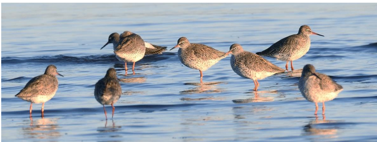
Рис. 7. Пролётная группа травников Tringa totanus . Южное Приморье, окрестности Владивостока, полуостров Де-Фриза. 23 мая 2019.

На Ханкайско-Раздольненской равнине весенний пролёт совсем не выражен (Глуценко и др. 2006а,б; 2008; Глуценко, Коробов 2020). Увеличение числа прибывших сюда птиц, со временем занимающих гнездовые станции, происходит в первой половине апреля. Несколько активнее миграции проходят и лучше прослежены вдоль морского побережья Южного Приморья, в частности, в вершинной части Амурского залива (в первую очередь в районе устья реки Шмидтовка у полуострова Де-Фриза). Здесь мигрируют преимущественно птицы северных популяций, при этом, по данным М.А.Омелько (1971), их массовый пролёт протекает во второй половине мая, когда на Ханкайско-Раздольненской рав-