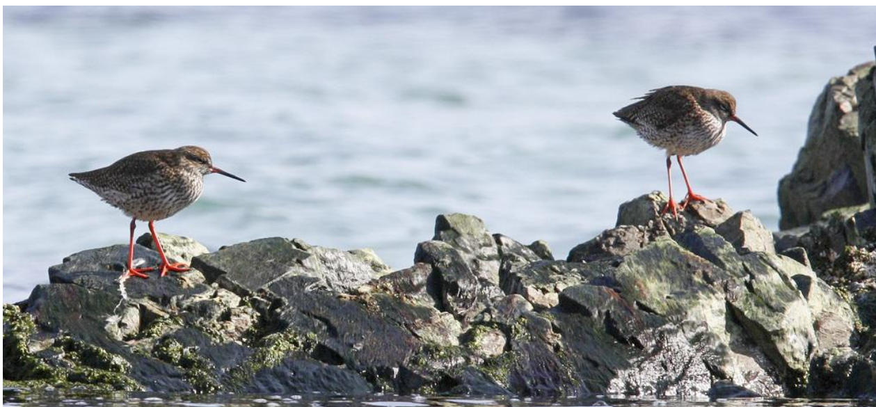
Рис. 6. Пролётные травники Tringa totanus в начале весенней миграции. Юго-Восточное Приморье, бухта Петрова. 22 марта 2022.

Столь рано прилетевшие птицы держатся в одиночку (рис. 5), реже парами (рис. 6) либо группами в несколько особей, и, судя по их последующему поведению, на Ханкайско-Раздольненской равнине они представлены главным образом особями местной гнездящейся группировки.