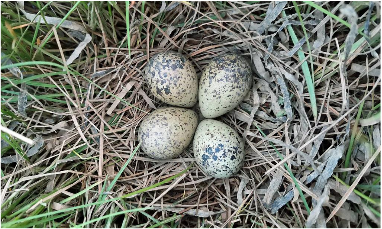
Рис. 25. Гнездо травника Tringa totanus , которое было подтоплено во время высокого прилива. Остров Байдукова, залив Счастья (Сахалинский залив). 29 июня 2022.