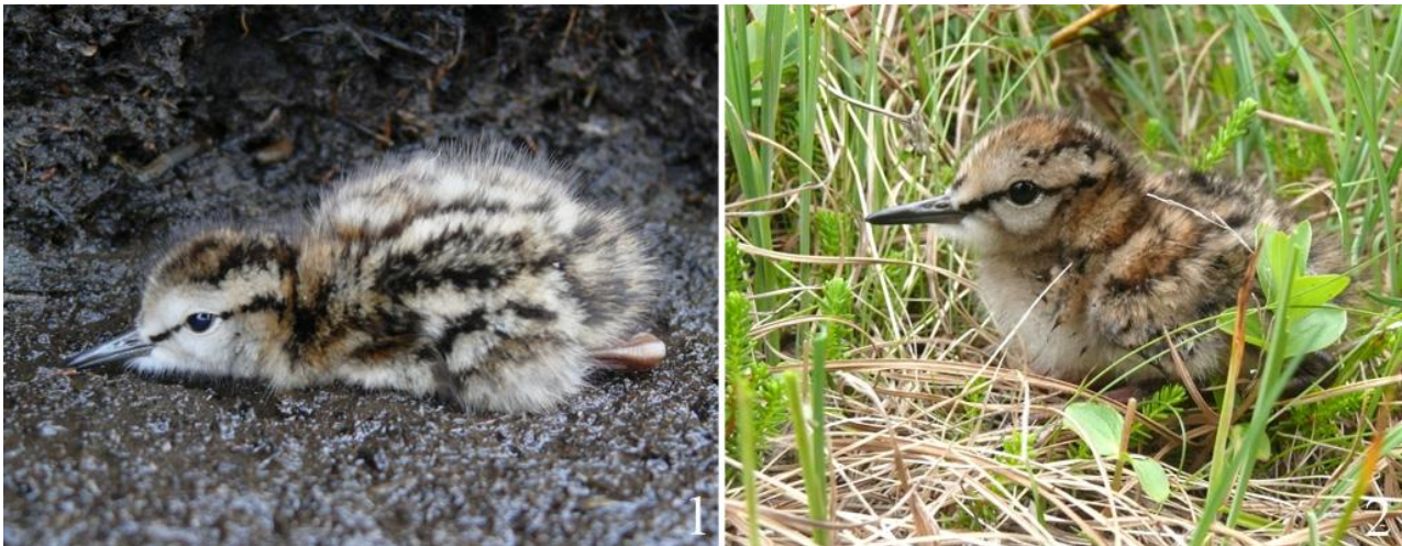
Рис. 19. Пуховой птенец уссурийского травника Tringa totanus ussuriensis . Северный Сахалин, остров Ляво, залив Даги. 17 июля 2009.

мая, а в начале июня добыли самку с готовым к сносу яйцом (Яхонтов 1963). Гнездо, содержащее кладку из 4 слабо насиженных яиц, обнаружили в заливе Константина 2 июля 1989 (Воронов, Пронкевич 1991). На островах Кевор и Дыгруж в заливе Счастья 26 и 27 июля 1986 наблюдали пуховых птенцов в возрасте около недели и в разной степени летающих молодых; в бухте Нерпичья плохо летающую молодую птицу встретили 9 августа 1996, а на реке Чёрная хорошо летающего молодого травника отметили 12 августа 1984 (Бабенко 2000).