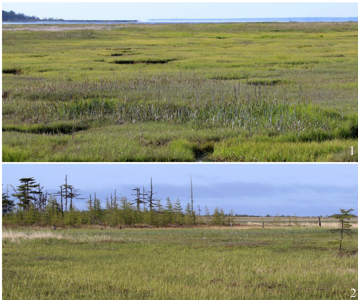
Рис. 11. Общий вид гнездовых станций уссурийских травников Tringa totanus ussuriensis на Северном Сахалине: 1 – залив Баури, 1 июля 2021; 2 – окрестности села Горячие Ключи, 28 июня 2021.

болоченными лиственничными лесами с многочисленными пресными и солоноватыми озёрами, осоковыми и осоково-моховыми болотами, обычно в устьях рек (Нечаев 1991) (рис. 11).