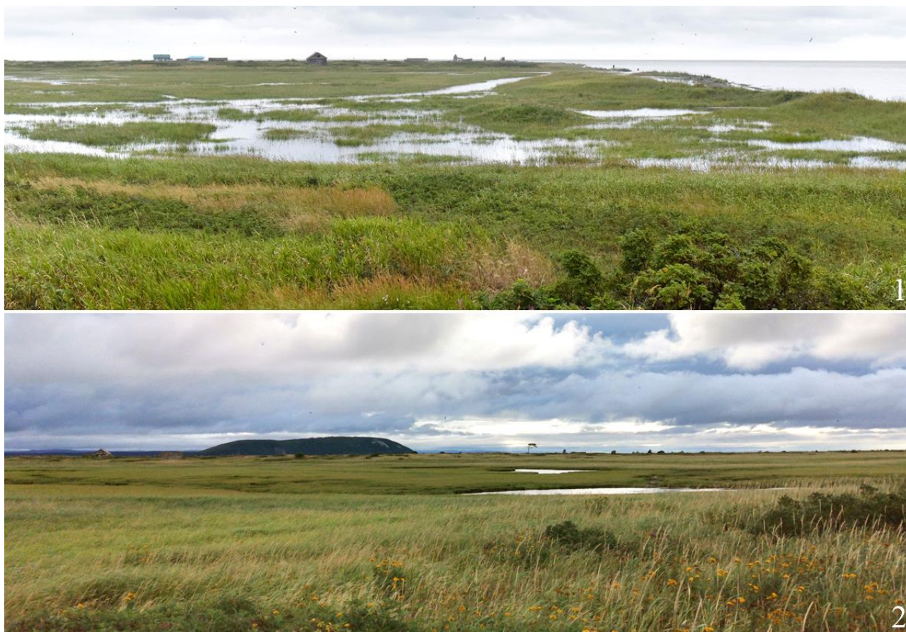
Рис. 12. Общий вид гнездовых станций уссурийских травников Tringa totanus ussuriensis на острове Байдукова в заливе Счастья. 1 – 11 августа 2022; 2 – 2 августа 2022.

лики гнездились, как отдельными парами, так и рыхлыми колониями. В ряде случаев на юге острова Байдукова они размещали гнёзда диффузно в обширном поселении камчатской крачки Sterna camtschatica .