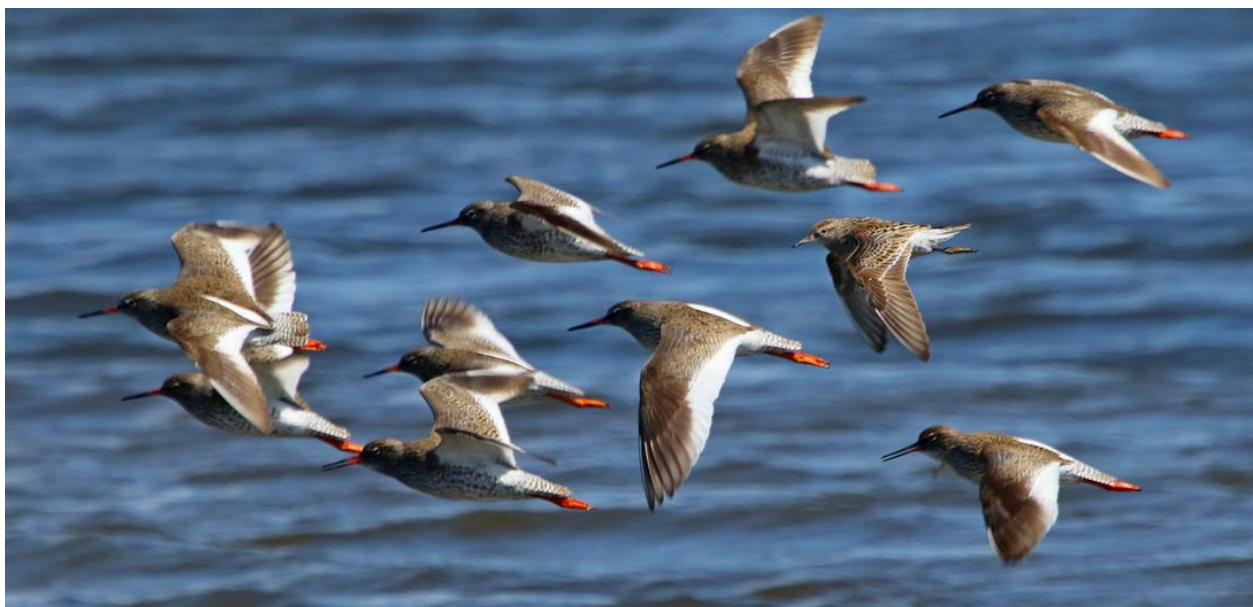
Рис. 9. Пролётная группа травников Tringa totanus . Устье реки Киевка. 2 июня 2020.

В Северо-Восточном Приморье во время северного пролёта травников наблюдали три раза: одиночную особь встретили 25 апреля 1996 на озере Благодатное; группу из трёх птиц зарегистрировали 31 мая 2004 в низовьях реки Серебрянки; взрослую самку добыли 11 июня 1990 на озере Благодатное (Елсуков 2013).