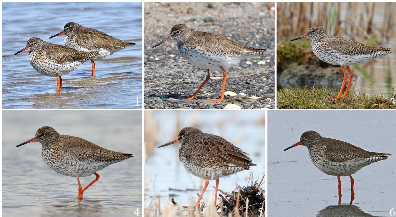
Рис. 1. Взрослые травники Tringa totanus в летнем наряде, Приморский край. 1 – остров Русский, 6 апреля 2022, фото А.В.Вялкова; 2 – остров Русский, 9 апреля 2021, фото А.В.Вялкова; 3 – окрестности Владивостока, полуостров Де-Фриза, 19 мая 2021, фото А.В.Вялкова; 4 – окрестности Владивостока, полуостров Де-Фриза, 16 мая 2022, фото А.В.Вялкова; 5 – восточное побережье озера Ханка, 27 марта 2016, фото Д.В.Коробова; 6 – бухта Преображение, 7 апреля 2022, фото В.П.Шохрина