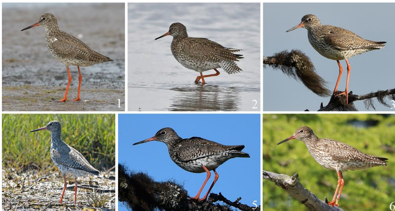
Рис. 3. Взрослые травники Tringa totanus в летнем наряде, остров Сахалин, залив Даги. 1 – 18 июля 2021; 2 – 17 июля 2021; 3 – 14 июля 2021; 4 – 2 июля 2021; 5 – 3 июля 2021; 6 – 7 июля 2021

Более детально область размножения уссурийского травника на русском Дальнем Востоке проработана в аннотированном каталоге «Птицы Дальнего Востока России» (Нечаев, Гамова 2009), но и эта информация требует дальнейшей детализации. Согласно нашим представлениям, распространение этого кулика в дальневосточном регионе носит кластерный характер. Наиболее крупный из таких кластеров, население которого можно условно назвать западно-приохотской популяцией, занимает прибрежные районы западной части Охотского моря. В свою очередь, он включает два территориально разобщённых фрагмента: материковый (хабаровская группировка) и островной (сахалинская группировка). Первый из них охватывает прибрежные районы Хабаровского края (рис. 4.1). Его известная северная граница проходит по Шантарским островам, но не исключено гнездование травника в устье реки Уда и несколько севернее. Наиболее южные пределы распространения хабаровской группировки выявлены на озере Удыль (Воронов, Пронкевич 1991; Росляков, Росляков 1996; Бабенко 2000; и др.) и в заливе Невельского, где, по нашим данным, поселения травника существуют в устьях рек Нигирь и Псю.