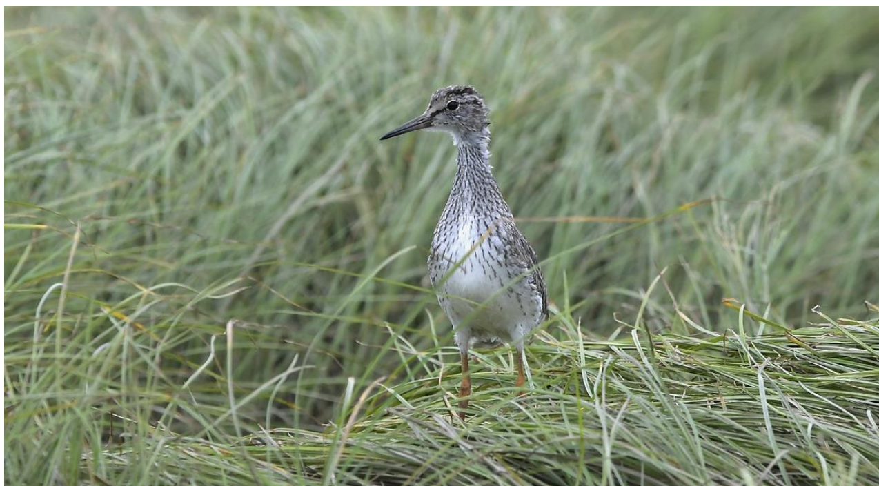
Рис. 24. Лётный птенец травника Tringa totanus . Остров Байдукова, залив Счастья (Сахалинский залив). 26 июля 2022.

Гнездовой период у травников на острове Байдукова сильно растянут: элементы брачных демонстраций мы неоднократно наблюдали ещё в первой декаде июля (рис. 23), а самое позднее гнездо с кладкой из 4 насиженных яиц осмотрели 21 июля (рис. 22.2). Первых ещё плохо летающих молодых особей отметили 26 июля (рис. 24).