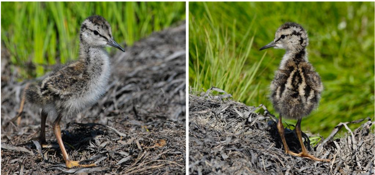
Рис. 20. Пуховой птенец уссурийского травника Tringa totanus ussuriensis . Северный Сахалин, залив Набильский. 12 июля 2010.

При работе на острове Байдукова в 2022 году мы не имели возможности проследить начало гнездового периода травников, поскольку проводили исследования с 28 июня по 22 августа. За этот период нашли 4 гнезда с полными кладками: 29 июня, 5 июля, 6 июля и 21 июля. Травники населяют большую часть острова, причём гнёзда они устраивают