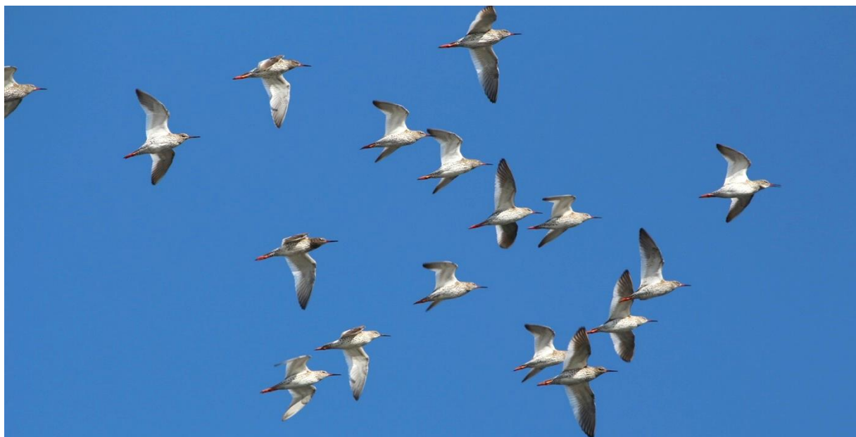
Рис. 8. Фрагмент пролётной стаи травников Tringa totanus . Южное Приморье, устье реки Киевка. 23 мая 2015.

Для залива Восток травник указан в качестве редкого пролётного вида, весенние миграции которого проходят в апреле и первой половине мая (Нечаев 2014). Для окрестностей Лазовского заповедника во время пролёта документировали лишь несколько встреч этих куликов: 2 птиц наблюдали 22 марта 2011 на побережье бухты Петрова; стаю из 31 особи встретили 23 мая 2015 в устье реки Киевка (рис. 8); группу, включавшую 9 травников, отметили там же 2 июня 2020 (рис. 9); одиночную особь зарегистрировали 7 апреля 2022 в окрестностях посёлка Преображение (Шохрин 2017; наши данные).