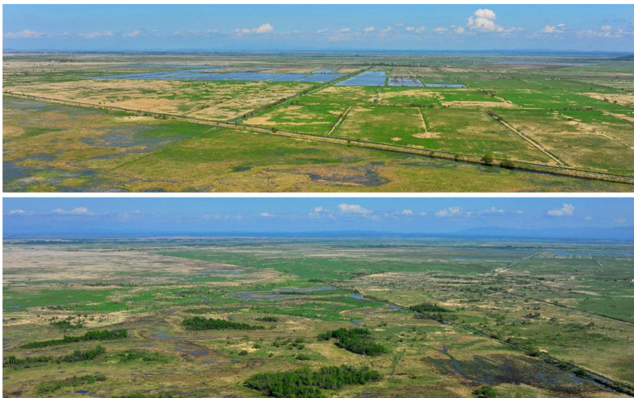
Рис. 10. Общий вид гнездовых станций уссурийских травников Tringa totanus ussuriensis на Приханкайская низменности. 23 мая 2013.

Местообитания. По нашим данным, гнездовыми биотопами на Приханкайской низменности травникам служат травяные болота и переувлажнённые внешними водами участки пастбищ, лугов и полей, в первую очередь, рисовых (рис. 10) (Глущенко 1979). Птицы селятся как отдельными парами, так и рыхлыми колониями, нередко вместе с чибисами Vanellus vanellus , поручейниками Tringa stagnatilis и ходулочниками Himantopus himantopus (Глущенко и др. 2006б; 2022).