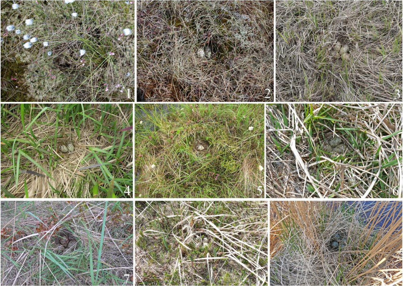
Рис. 16. Гнёзда уссурийских травников Tringa totanus ussuriensis с кладками на Северном Сахалине. 1 – залив Чайво, 28 июня 2005; 2 – залив Чайво, 12 июня 2006; 3 – залив Чайво, 24 июня 2007; 4 – полуостров Шмидта, 11 июля 2007; 5 – полуостров Шмидта, 15 июля 2007; 6 – залив Пильтун, 22 июня 2008; 7 – залив Даги, 16 июля 2008; 8 – залив Пильтун, 24 июня 2010; 9 – залив Помрь, 14 июня 2011