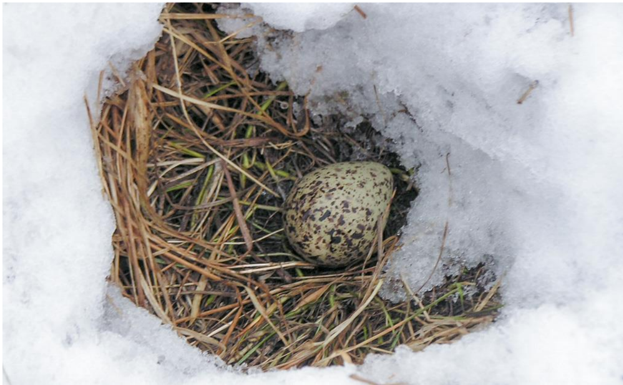
Рис. 13. Гнездо травника Tringa totanus , отчасти засыпанное снегом. Приханкайская низменность, окрестности села Вадимовка (Хорольский район). 10 апреля 2005.

Помимо этого, на территории Ханкайско-Раздольненской равнины 2 гнезда с неполными кладками мы нашли 8 мая 2006 (рис. 14), а 9 гнёзд с полными кладками в разные годы осмотрели с 27 апреля по 27 мая.