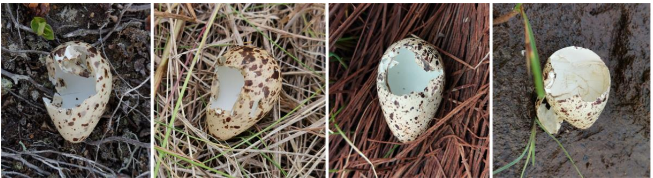
Рис. 26. Яйца травника Tringa totanus , расклёванные врановыми. Остров Байдукова, залив Счастья (Сахалинский залив). Июль 2022 года.

На Сахалине (залив Чайво) отметили случай нападения на выводок суточных пуховичков травника в колонии камчатских крачек, в результате которого птенцов насмерть заклевали крачки. Ещё одного забитого этими птицами пуховичка обнаружили 17 июля 2009 на острове Лярво (залив Даги), и там же нашли мёртвого птенца, на которого наступил бурый медведь Ursus arctos (Тиунов, Блохин 2011).