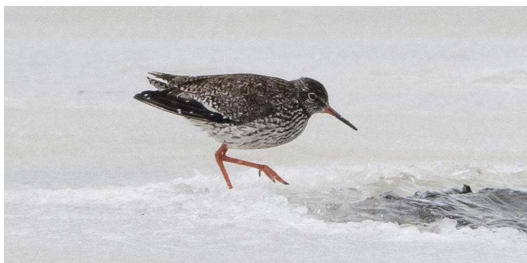
Рис. 5. Травник Tringa totanus в начале весенней миграции. Озеро Ханка, устье реки Спасовка. 21 марта 2019.