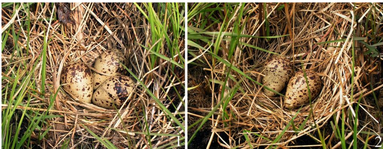
Рис. 14. Гнёзда травников Tringa totanus с неполными кладками. Ханкайско-Раздольненская равнина, окрестности Уссурийска. 8 мая 2006.

Гнёзда травников представляют собой небольшие углубления, которые на Ханкайско-Раздольненской равнине выстланы в основном сухой травой (рис. 13, 14). По данным В.А.Нечаева (1991), на Сахалине гнёзда выстилаются сухими листьями осоки и ивы. В большинстве гнёзд трав-