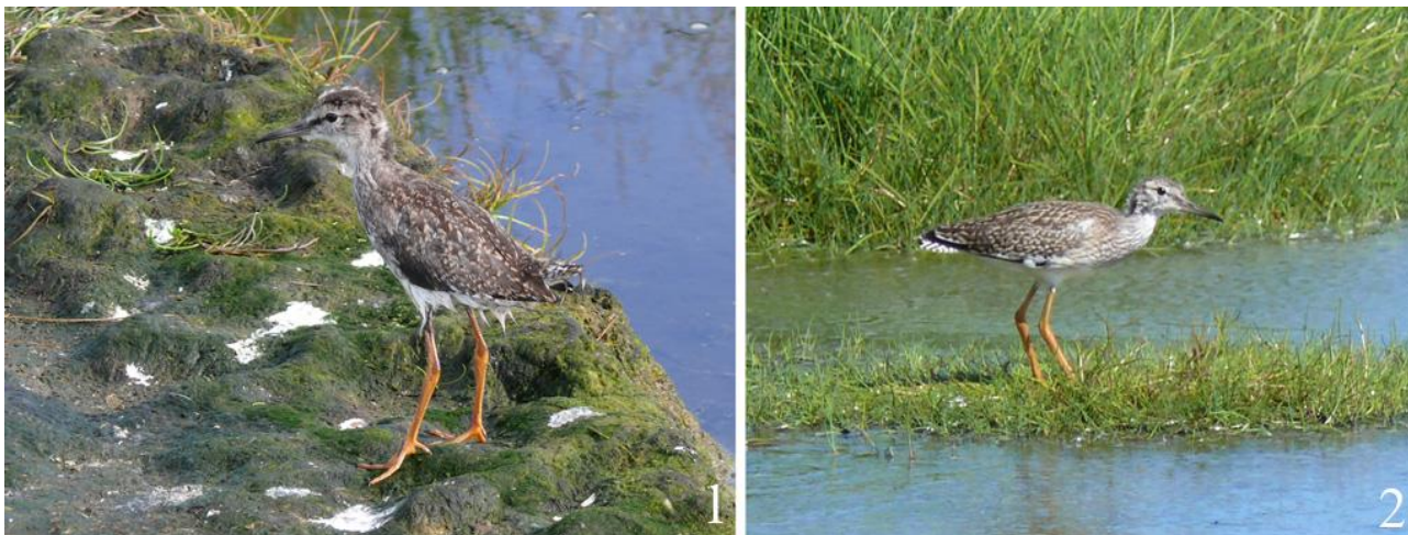
Рис. 21. Плохо летающий птенец уссурийского травника Tringa totanus ussuriensis . Северный Сахалин, остров Лявво. 4 августа 2010.

в самых разных биотопах: от прибрежных травянистых зарослей у про- ток и заболоченных понижений (рис. 22.3), до возвышенных гребней песчаных дюн, заросших шикшей сибирской и цветущим разнотравьем (рис. 22.1,2).