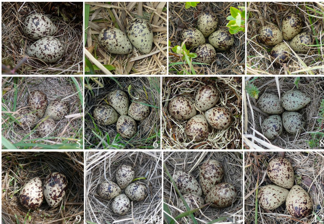
Рис. 18. Кладки уссурийских травников Tringa totanus ussuriensis с Северного Сахалина.

Основные вариации окраски яиц травника в кладках, найденных на Сахалине, подробно описаны В.А.Нечаевым (1991). Мы имеем возможность дополнительно к его описаниям проиллюстрировать их изменчивость, используя собранный нами фотоматериал (рис. 18).