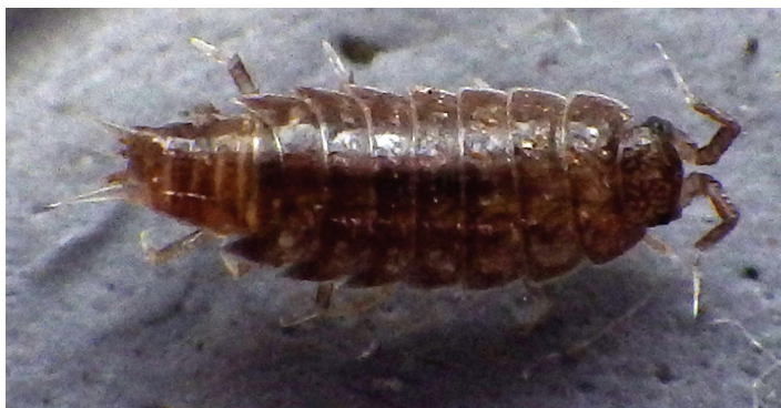
Рис. 5. Мокрица Hyloniscus riparius (C. Koch, 1838).

Замечания. Мелкая гигрофильная мокрица, длина тела 4 мм (рис. 5). Окраска тела розовато-буроватая, поверхность его гладкая, голова без выраженной срединной лопасти, боковые лопасти маленькие, трехгранные с тремя короткими щетинками. Заносной вид, нативный ареал – Центральная и Восточная Европа (Островский, 2019). В настоящее время наблюдается расширение ареала в европейской части России (Гонгальский и др., 2013), причем этот вид встречается как в лесных экосистемах, так и на затопляемых приусадебных участках вблизи временных и постоянных водоемов; в лесных стациях его численность возрастает с увеличением антропогенной нагрузки (Островский, 2019). В Приморье H. riparius указывался с побережья залива Посыет (Гонгальский, Кузнецова, 2020). Находка в границах Владивостока в ненарушенном природном биотопе указывает на успешную натурализацию данного вида на Дальнем Востоке.