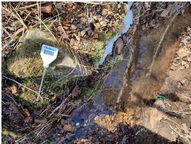
Рис. 3. Характер субстрата по берегам гелокрена в местах сбора членистоногих и положительная надпочвенная температура при отрицательной температуре воздуха (10 марта 2024 г.).

Данный родник у истока и ниже на протяжении 4 м классифицирован как гелокрен из-за малого расхода воды (около 0,5 л в сек), слабого напора и уклона поверхности, а также расположенных рядом еще нескольких мало-заметных просачиваний (Springer, Stevens, 2009). Пробы брались именно на этом коротком участке в районе гелокрена – с сырого субстрата вокруг основного источника (рис. 2) и малых просачиваний рядом на дне оврага, а также на его склонах. Прибрежный субстрат представлен листовым опадом, детритом, песком, мхом, камнями и валежником (рис. 3).