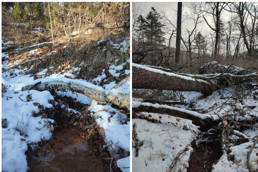
Рис. 2. Верхний (исток) и нижний участки незамерзающего гелокрена (основной источник) общей длиной около 4 м (14 января 2024 г.).