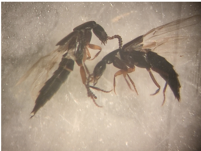
Рис. 4. Жуки-стафилиниды Gabrius sp.