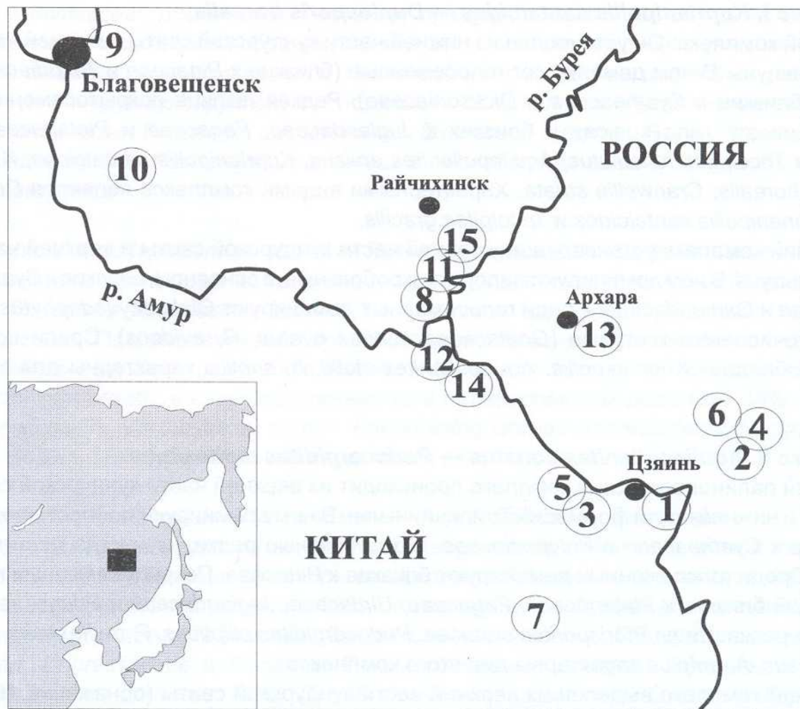
Рис. 2. Схема расположения местонахождений изученных верхнемеловых и палеогеновых разрезов: 1 — формация Юн'аньцунь, 2 — нижняя часть кундурской свиты, 3 — формация Тайпинлиньчан, 4 — верхняя часть кундурской свиты (обнажения 15, 16), 5 — формация Юйлянцзы (местонахождение динозавров Лунгушань), 6 — нижнецагайская подсвита (Кундурское местонахождение динозавров), 7 — формация Юйлянцзы (местонахождение динозавров Улага), 8 — нижнецагайская подсвита (местонахождение 202 вблизи Асташихи), 9 — нижнецагайская подсвита (Благовещенское местонахождение динозавров), 10 — нижнецагайская подсвита (Гильчинское местонахождение динозавров), 11 — обнажения 160–201 вблизи гор Белая и Плоская (стратотип цагайской свиты), 12 — разрезы формаций Фужао и Уюнь, 13 — Архаро-Богучанское месторождение угля, 14 — месторождение угля Уюнь, 15 — Райчихинское месторождение угля

проекта «Biota at the K-T boundary in Heilongjiang River basin» (руководитель — проф. Сунь Ге, Университет г. Цзилинь, КНР), мы имели возможность посетить разрезы правобережья р. Амур. Нами были просмотрены хорошо обнаженные разрезы верхнего мела и палеогена, отобраны многочисленные пробы, получены палинологические данные, установлен возраст отложений и проведена корреляция стратиграфических подразделений лево- и правобережья. Было обработано около 3000 проб и получена палинологическая характеристика каждой формации. На карте приведено местоположение изученных разрезов (рис. 2).