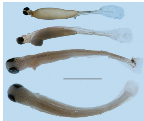
Рис. 3. Разновозрастные предличинки обыкновенного горчача Rhodeus sericeus из перловицы Nodularia douglasiae . Масштабная линейка 2 мм