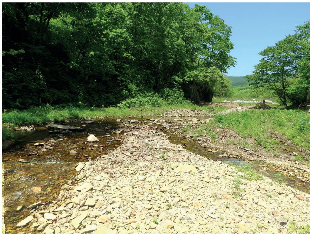
Рис.1. Ручей в посёлке Рыбачий.

Отбор проб для работ по изучению жизненных циклов подёнок производился с периодичностью в две недели с 29 октября 2015 г. по 05 октября 2016 г. За это время ледостав на ручье наблюдался дважды: с 26 ноября по 10 декабря 2015 г. и с 6 января до середины марта 2016 г. В эти периоды взятие проб производилось только на перекате на участке, искусственно освобожденном ото льда. В целом, температурный фон водотока в