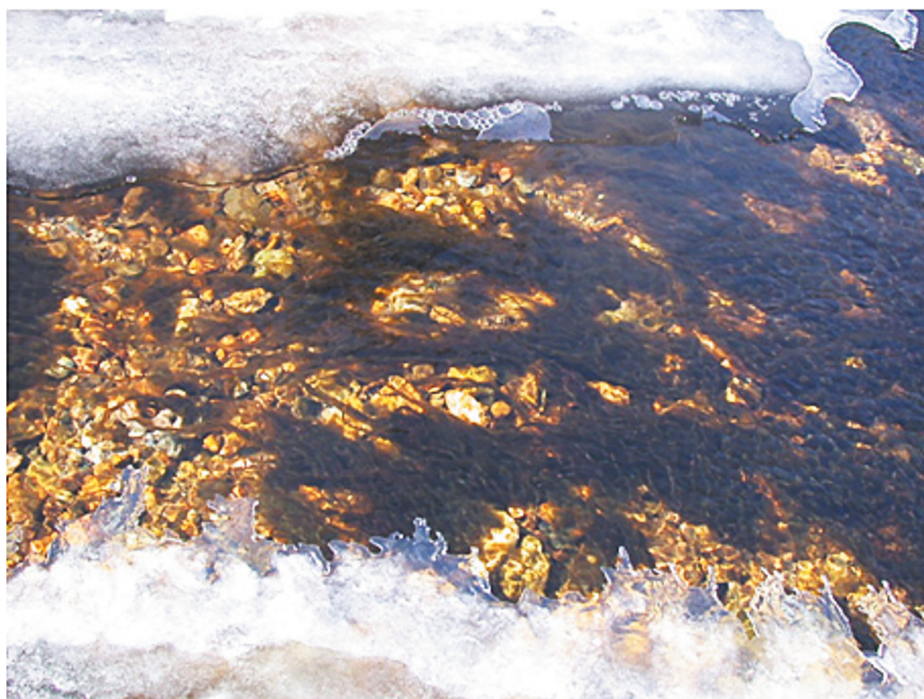
Рис. 1. Водоросль Hydrurus foetidus в р. Кедровая ранней весной. Фото А. Ю. Семенченко, март 2005.

При микроскопическом изучении гидрурус выглядит как разнообразно разветвлённые кустики, состоящие из общей слизистой массы, в которую погружены овально-треугольные желтовато-бурые клетки, густо расположенные на периферии и более рыхло в центральной части слизи колонии (так называемая пальмеллоидная структура). В колониях почти всегда можно различить главный ствол и боковые разветвления (рис. 2А, 2В). При большом увеличении в клетках виден один крупный постенный чашевидный хлоропласт с одним голым пиреноидом. В живых клетках можно увидеть зёрнышко лейкозина (запасное питательное вещество), несколько пульсирующих вакуолей, а после окраски и центральное ядро. В кончике каждого ответвления имеется только одна верхушечная (апикальная) клетка. Таллом может расти только за счет деления этих клеток, таким образом осуществляется верхушечный рост главной оси и каждого ее ответвления. При бесполом размножении