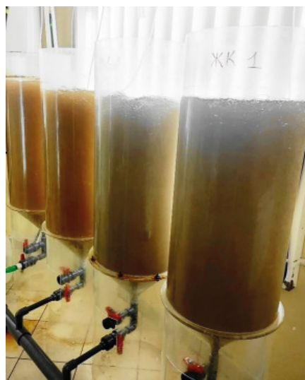
Рис. 3. Установка для инкубации цист Artemia salina .