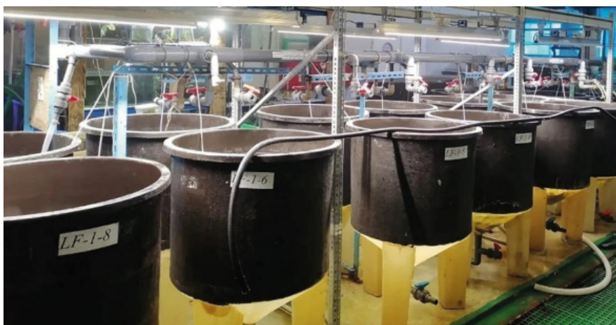
Рис. 4. Система емкостей для выращивания рачка Artemia salina .