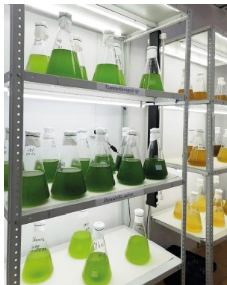
Рис. 1. Маточная культура микроводорослей.

Культивирование микроводорослей осуществляется путём периодического пересевания на свежую питательную среду. Периодическим пересевом культуры микроводоросли поддерживают длительное время и, при необходимости, наращивают в больших объёмах. В процессе культивирования микроводорослей ежедневно визуальную оценивают состояние культуры, её цвет, распределение клеток в суспензии. По необходимости проводят подсчёт клеток под микроскопом. При выращивании микроводорослей в стеклянных колбах толщина слоя суспензии небольшая, поэтому на этом этапе интенсивность освещения поддерживается на уровне от 2 до 6 клк, световой режим 12 часов свет: 12 часов темнота. В больших объёмах толщина