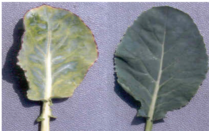
Рис. 4. Симптомы поражения цветной капусты ( Brassica cauliflora ) вирусом мозаики цветной капусты ( Ortervirales, Caulimoviridae, Caulimovirus ): слева – лист инфицированного, справа – неинфицированного растения.

листьев и задержка роста растений. Семенную передачу ВМЦК не наблюдали. Однако, вирусная инфекция влияет на всхожесть семян, снижая её в некоторых случаях до 100 %, возможно, – за счёт повреждения зародыша. Иногда, больные растения производят мелкие семена с тонкой морщинистой оболочкой, из которых никогда не вырастут полноценные растения. Природными резервуарами ВМЦК являются сорняки из сем. Brassicaceae, например, – сурепка обыкновенная ( Barbarea vulgaris ), пастушья сумка ( Capsella bursa-pastoris ). Вирус сохраняется в зараженных маточных растениях и в кочерыгах Brassica spp., оставленных необранными в поле. Возбудитель заболевания легко передается тлями. Такие виды, как M. persicae и L. erysimi , способны переносить ВМЦК даже после одного кратковременного пробного укола больного растения. В отличие от них, капустная тля ( Brevicoryne brassicae ) переносит ВМЦК лишь после длительного кормления, при этом способность к инфицированию сохраняется более 24 ч. Неспецифическая для растений сем. Brassicaceae тля A. pisum также способна переносить ВМЦК лишь продолжительного его восприятия (Namba, Silvester, 1981).