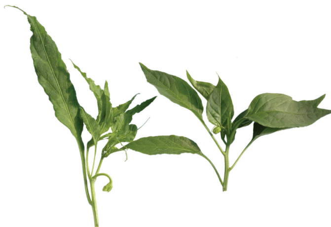
Рис. 3. Симптомы поражения перца вирусом огуречной мозаики ( Bromoviridae , Cucumovirus ): слева – лист инфицированного, справа – неинфицированного растения.

являются резервуарами вирусной инфекции, и с массовым распространением тлей-переносчиков вирусов.