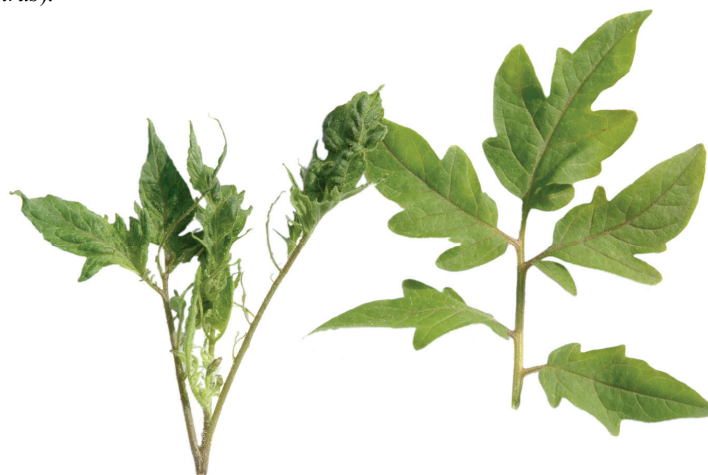
Рис. 2. Симптомы поражения томата вирусом огуречной мозаики ( Bromoviridae , Cucumovirus ): слева – лист инфицированного, справа – неинфицированного растения.

Следует подчеркнуть, что ВОМ широко распространён как в открытом грунте, так и в теплицах. Число больных растений существенно колеблется в зависимости от места выращивания культуры. Поражение огуречных посадок ВОМ в открытом грунте ниже, чем в теплицах. В то же время на индивидуальных участках число больных растений заметно выше. Это связано с выращиванием на огородах или дачных участках различных видов растений, многие из которых