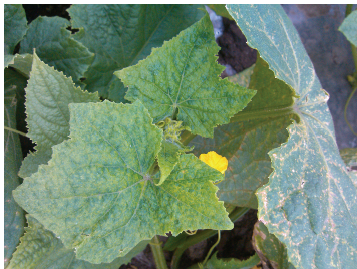
Рис. 1. Симптомы поражения огурца вирусом огуречной мозаики ( Bromoviridae , Cucumovirus ).