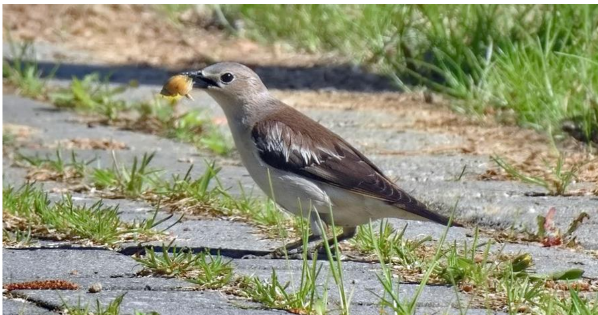
Рис. 16. Самка малого скворца Sturnia sturnina с найденным моллюском. Залив Петра Великого, остров Русский, 17 мая 2021.