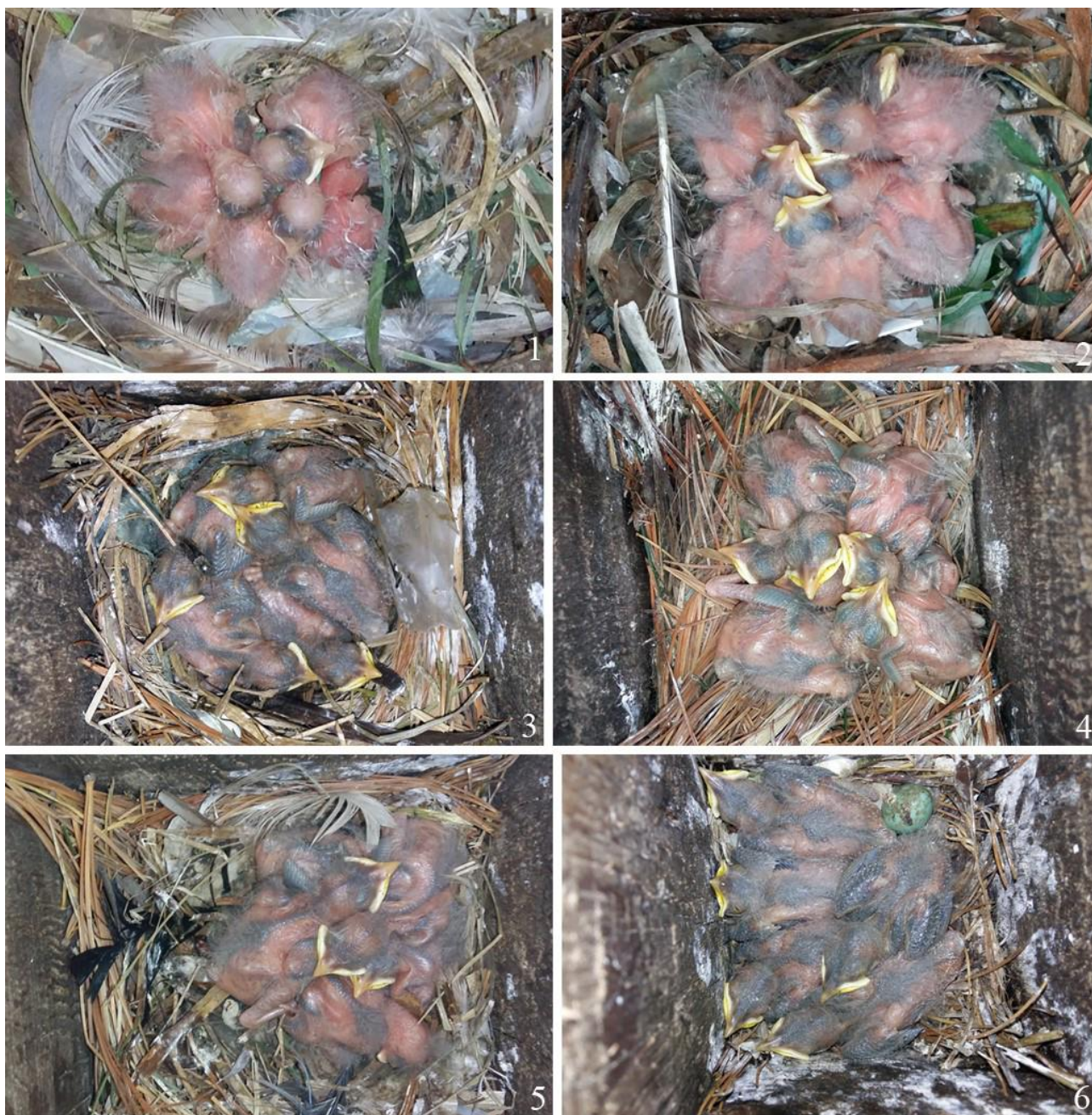
Рис. 9. Птенцы малого скворца Sturnia sturnina младшего возраста. Надеждинский район, окрестности села Мирное: 1 – 2 июня 2022; 2 – 10 июня 2023; 3 – 14 июня 2022; 4 – 6 июня 2022; 5, 6 – 14 июня 2022.

Вылупление длится около суток; вес только что вылупившихся птенцов ( n = 10 ) варьирует от 2.7 до 3.3, в среднем составляя 3.0 г, но уже к концу первого дня жизни он был 5.0-6.45, в среднем 5.38 г ( n = 18 ); вес птенцов быстро увеличивался в первые 10-11 дней, несколько снижаясь к моменту вылета молодых птиц (Лаптев 1984). Чаще всего птенцы появляются в первой, редко – во второй половине июня (табл. 2; рис. 9), при этом в течение нескольких последующих дней взрослые птицы их согревают (рис. 10).