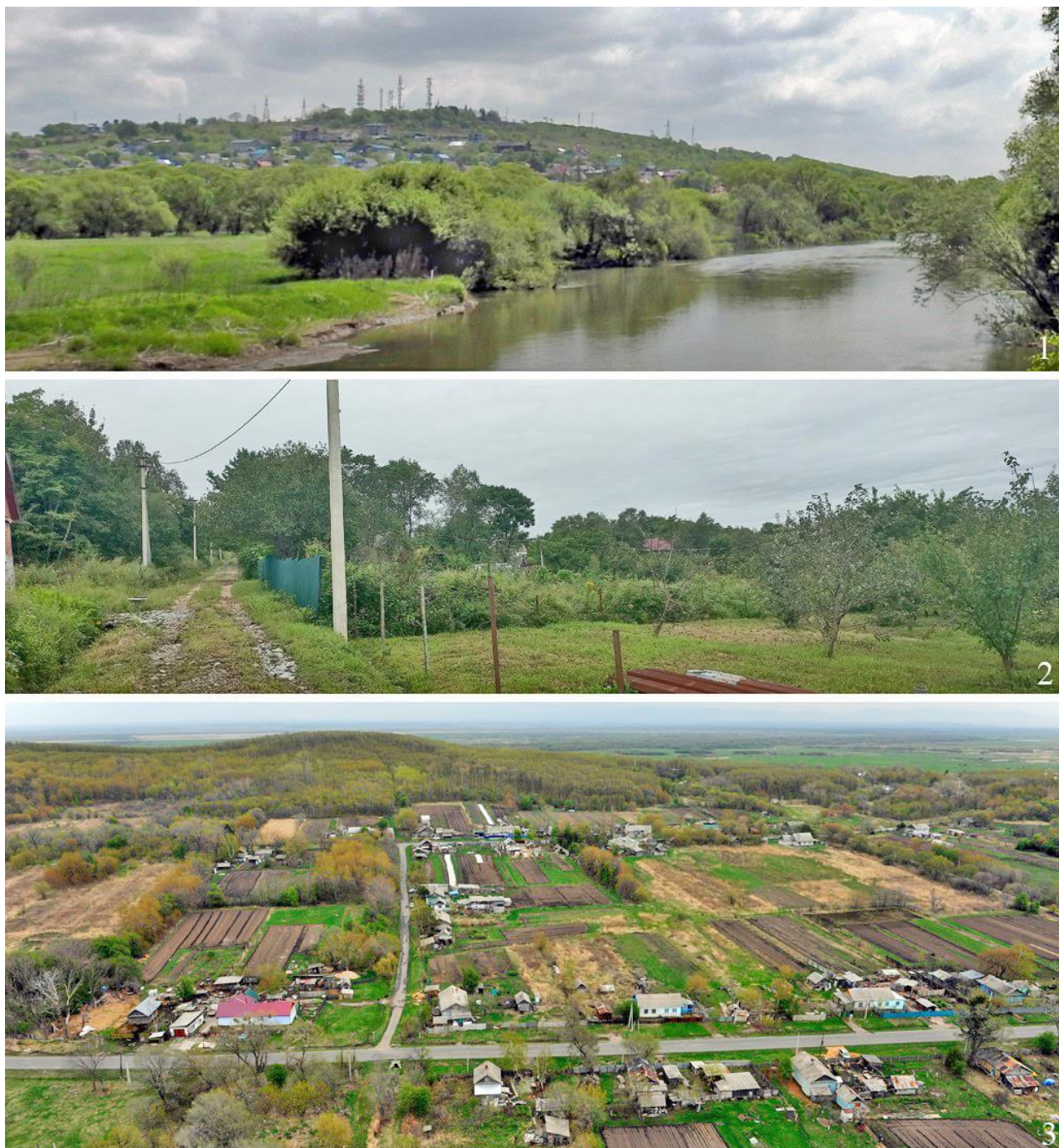
Рис. 2. Типичные местообитания малого скворца Sturnia sturnina . 1 – окрестности Уссурийска, 5 мая 2020; 2 – Надеждинский район, окрестности села Мирное, 31 августа 2023; 3 – Спасский район, село Гайворон, 9 мая 2016

Местообитания. Гемисинантропный вид, более тесно связанный с населёнными пунктами, чем, например, серый скворец (Воробьёв 1954; наши данные). Населяет преимущественно антропогенный ландшафт, а также опушки и редколесья, избегая сомкнутых лесных массивов и горных участков, являясь классическим видом антропогенной лесостепи (Глущенко и др. 2016). В окрестностях Уссурийска малые скворцы гнездятся главным образом в районах частной и дачной застройки, в небольшом количестве населяют долины рек и окраины сопковых дубняков, расположенных недалеко от районов застройки. На Приханкайской