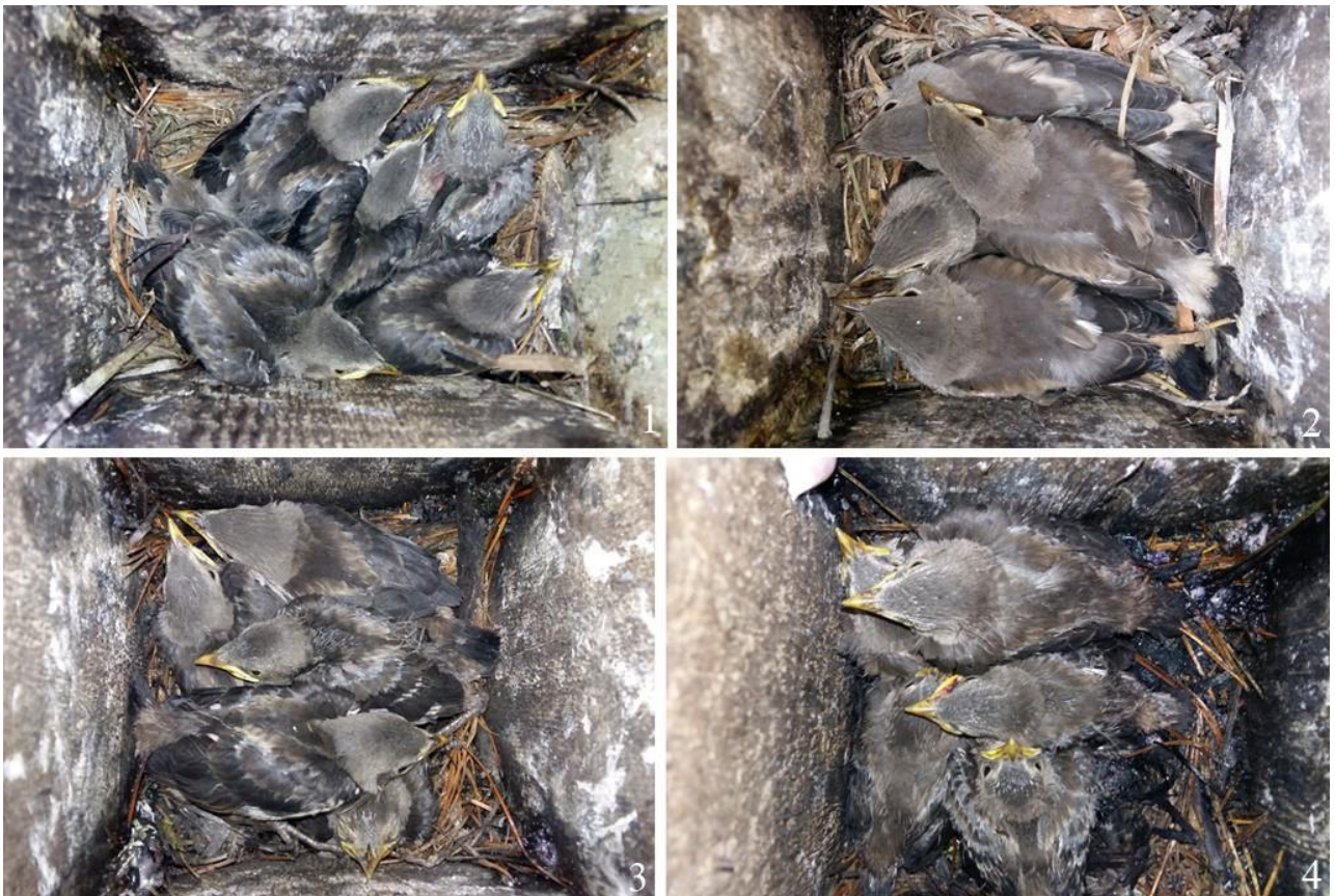
Рис. 11. Птенцы малого скворца Sturnia sturnina старшего возраста. Надеждинский район, окрестности села Мирное: 1 – 14 июня 2022; 2 – 15 июня 2022; 3-4 – 21 июня 2022.