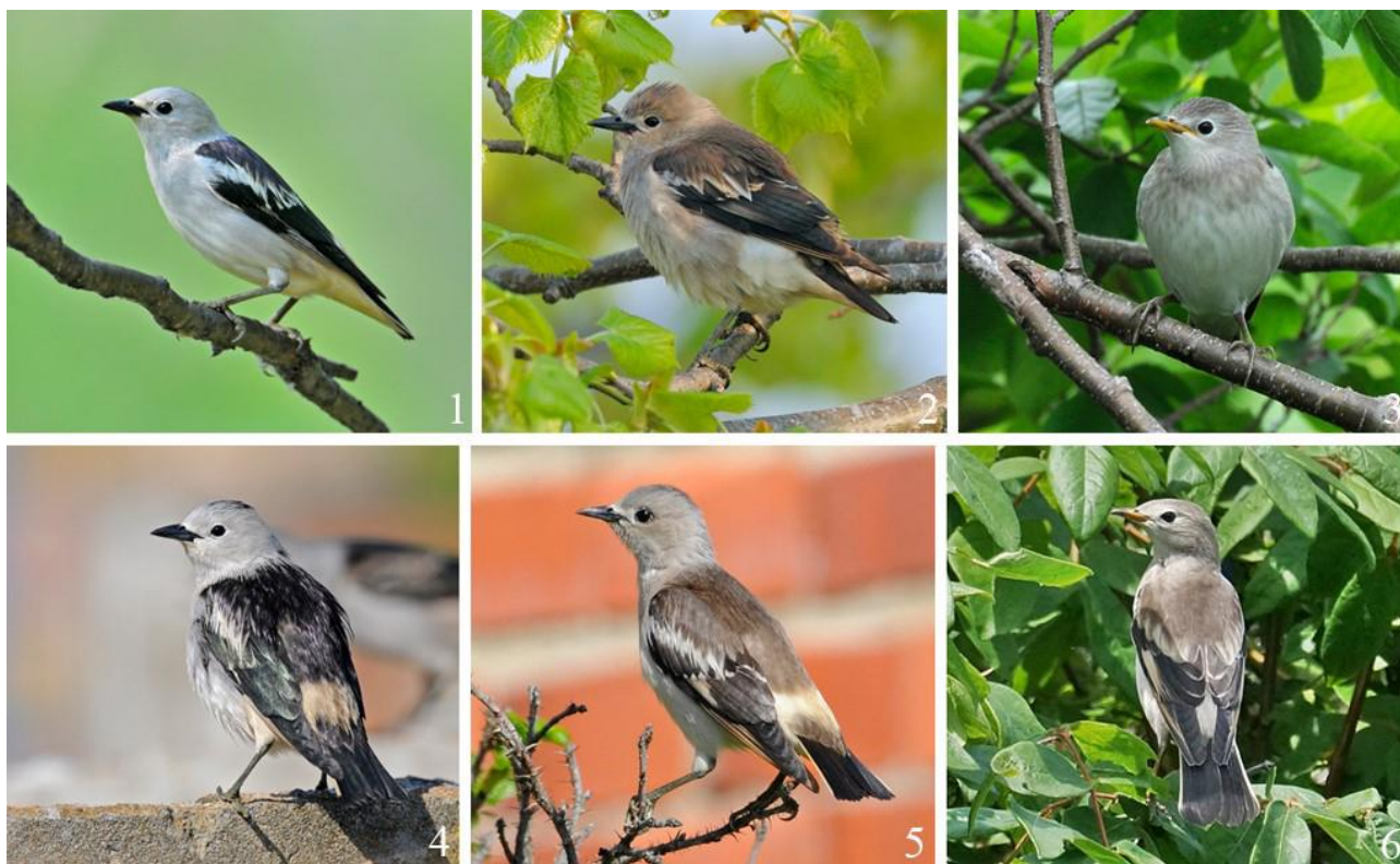
Рис. 1. Малые скворцы Sturnia sturnina . 1, 4 – взрослые самцы; 2, 5 – взрослые самки; 3, 6 – молодые птицы. 1 – Спасский район, 20 июня 2011; 2 – Хасанский район, окрестности бухты Спасения, 14 мая 2015, 3 – залив Петра Великого, остров Попова, 2 июля 2016; 4 – там же, 18 мая 2016; 5 – там же, 18 мая 2016; 6 – Надеждинский район, окрестности села Мирное, 27 июня 2022.

Статус. Малый скворец Sturnia sturnina (Pallas, 1776) – в целом малочисленный, но местами обычный гнездящийся перелётный вид, численность которого динамична (рис. 1).