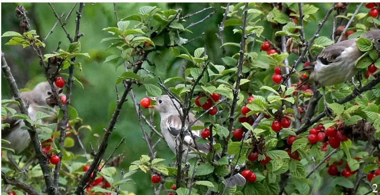
Рис. 18. Молодые малые скворцы Sturnia sturnina , кормящиеся сочными плодами. 1 – залив Петра Великого, остров Путятина, 19 июля 2016; 2 – Надеждинский район, окрестности села Мирное, 13 июля 2022

Птенцов малые скворцы кормят разнообразной пищей животного происхождения, в состав которой, помимо насекомых и их личинок, входят паукообразные и моллюски (Лаптев 1984; рис. 17).