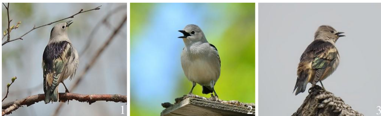
Рис. 4. Поющие самцы малого скворца Sturnia sturnina . 1 – окрестности Владивостока, 3 мая 2015; 2 – залив Петра Великого, остров Русский, 25 мая 2021; 3 – там же, 6 мая 2022

Малый скворец является облигатным дуплогнездником, но при этом он не очень требователен к дуплу, охотно занимая разнообразные щели в жилых зданиях, пустоты под крышами домов, за наличниками окон и прочие ниши (Поливанов 1981). На Приханкайской низменности большая часть гнездящейся группировки приурочена к населённым пунктам сельского типа, где эти скворцы обычно селятся в скворечниках и в нишах разных строений. На опушках, вдали от селитебных территорий, они гнездятся в дуплах деревьев, реже в пустотах каркасов крупных гнёзд ястребиных и голенастых птиц (Глущенко и др. 2006б). В окрестностях Владивостока и Уссурийска гнёзда малых скворцов размещаются в нишах зданий и прочих конструкций, а также в скворечниках и дуплах деревьев (Назаров 2004; Глущенко и др. 2006а). В Лазовском районе они отдают предпочтение скворечникам, но заселяют также дупла, щели под крышами домов и других построек, в ряде случаев занимая старые гнёзда рыжепоясничных ласточек (Лаптев 1984; 1986а,б).