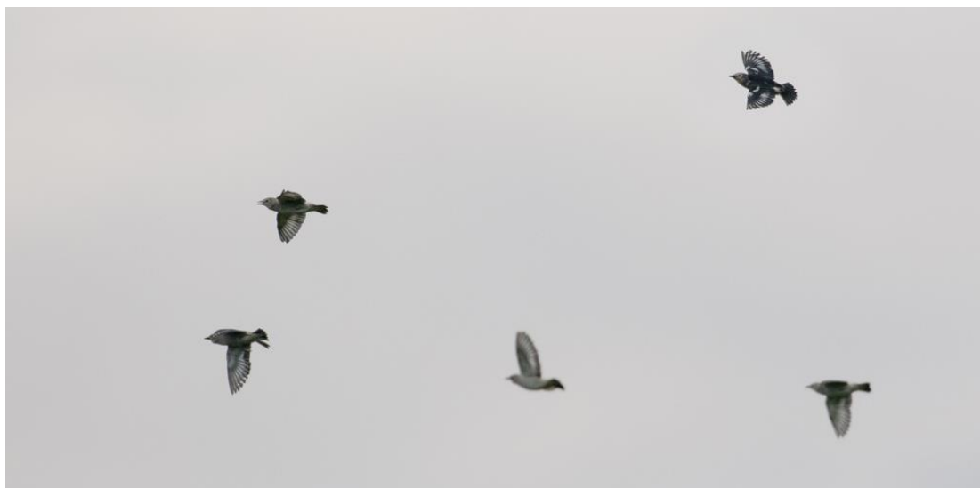
Рис. 14. Кочующий выводок малых скворцов Sturnia sturnina . Залив Петра Великого, остров Попова, 2 июля 2016.

территорию Приморского края. В окрестностях Лазовского заповедника осенний отлёт не выражен. Последнюю стайку, состоящую из 11 птиц, наблюдали в посёлке Мелководное 22 августа 1972 (Лаптев 1984). В окрестностях села Киевка 31 августа 2011 встретили 8 малых скворцов в общей стае с китайскими Sturnia sinensis и серыми скворцами (Шохрин 2017). В низовье реки Туманная, на границе с КНДР, 13 августа 2023 мы наблюдали стаю, насчитывающую около 60 малых скворцов.