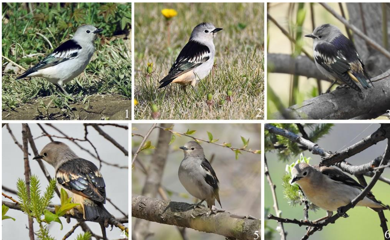
Рис. 3. Передовые пролётные малые скворцы Sturnia sturnina . 1 – Надеждинский район, село Сиреневка, 2 мая 2021, фото А.П.Ходакова; 2 – залив Петра Великого, остров Русский, 3 мая 2023, фото А.В.Вялова; 3 – там же, 6 мая 2022, фото И.А.Малькиной; 4 – окрестности города Находка, 8 мая 2019, фото Т.А.Прядун; 5 – окрестности Владивостока, 3 мая 2015, фото А.В.Вялова; 6 – окрестности города Находка, 4 мая 2019, фото Т.А.Прядун

тесной связью с древесной растительностью, в кронах которой ко времени вылупления птенцов насекомые становятся многочисленными, что в наземном слое, где в большей степени кормятся серые скворцы, происходит раньше.