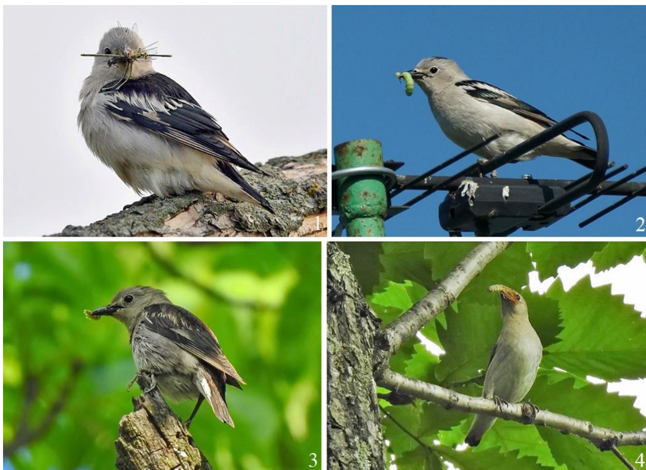
Рис. 17. Малые скворцы Sturnia sturnina с кормом для птенцов. 1 – восточное побережье озера Ханка, 15 июня 2022; 2 – Надеждинский район, окрестности села Мирное, 11 июня 2020; 3 – залив Петра Великого, остров Русский, 19 июня 2020; 4 – там же, 1 июля 2020

Питание. Как и все скворцы, рассматриваемый вид всеяден со сменной преобладающих кормов в разные фенологические периоды. Отме-