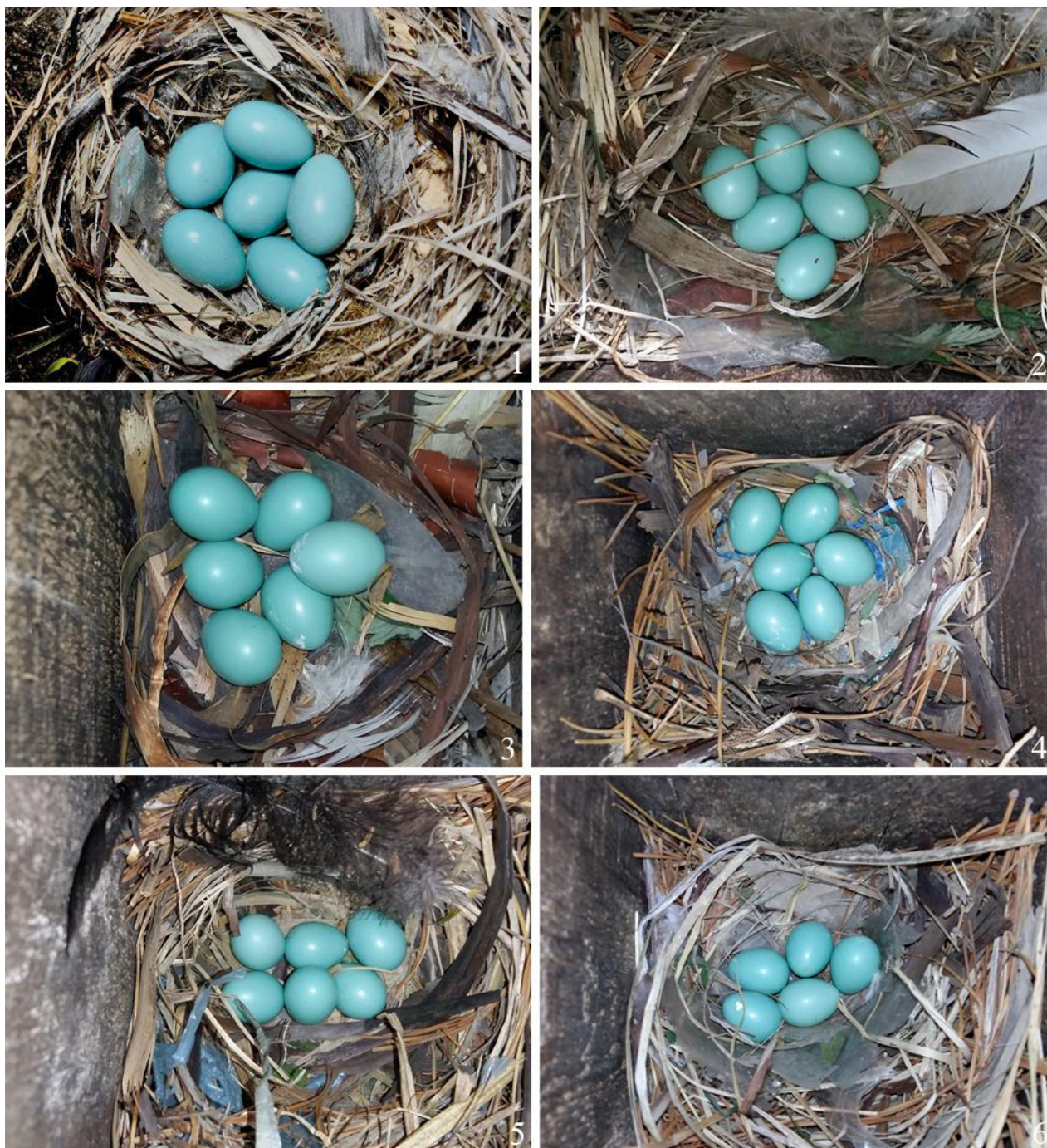
Рис. 8. Гнёзда малого скворца Sturnia sturnina с кладками. 1 – восточное побережье озера Ханка, 3 июня 2011; 2 – Надеждинский район, окрестности села Мирное, 21 мая 2019; 3 – там же, 19 мая 2020; 4 – там же, 29 мая 2022; 5 – там же, 30 мая 2022; 6 – там же, 2 июня 2022

Известна смешанная кладка малого и серого скворцов, которая собрана Е.П.Спангенбергом в низовье Большой Уссурки (Имана) 4 июня 1954. Она принадлежала малым скворцам и содержала 5 ненасиженных яиц малого скворца и 2 яйца серого скворца (Джусупов 2018).