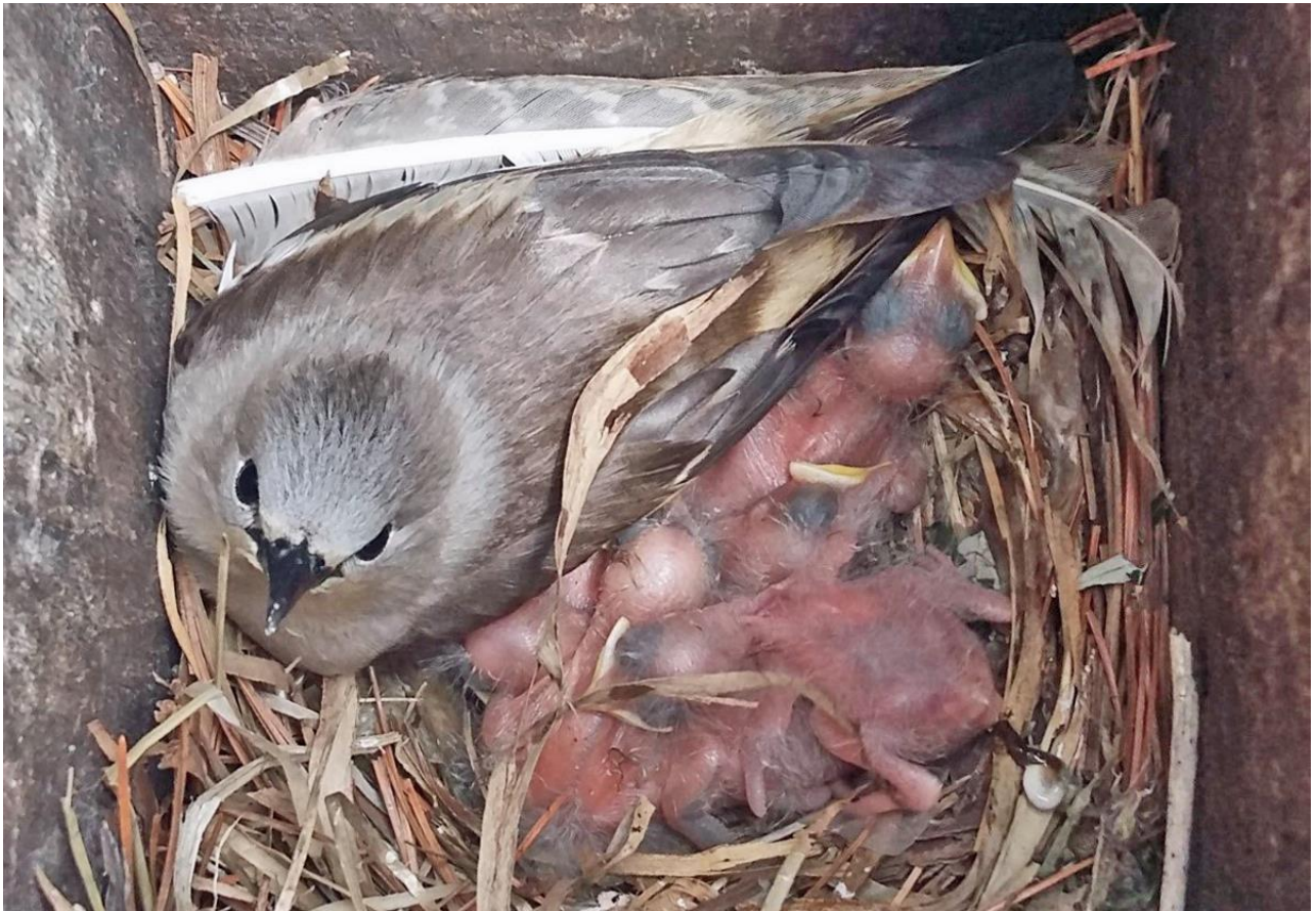
Рис. 10. Самка малого скворца Sturnia sturnina , согревающая птенцов. Надеждинский район, окрестности села Мирное, 11 июня 2023.