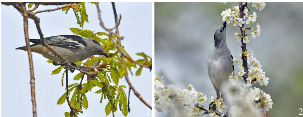
Рис. 15. Малые скворцы Sturnia sturnina , кормящиеся на цветущих растениях. 1 – восточное побережье озера Ханка, 20 мая 2011; 2 – окрестности Уссурийска, 10 мая 2021.

Осенью на материковой части Приморья этот вид крайне редок, в частности, в окрестностях Уссурийска единственная встреча одиночной особи зарегистрирована 2 октября 2002 (Глущенко и др. 2006а). Указания на то, что на пролёте на островах залива Петра Великого малые скворцы в отдельные годы многочисленны с конца августа до октября (Лабзюк и др. 1971) не подтверждены каким-либо конкретным материалом или последующими наблюдениями.