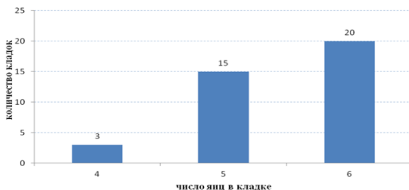
Рис. 7. Число яиц в полных кладках малого скворца Sturnia sturnina в Приморском крае (наши данные за 2011-2022 годы)