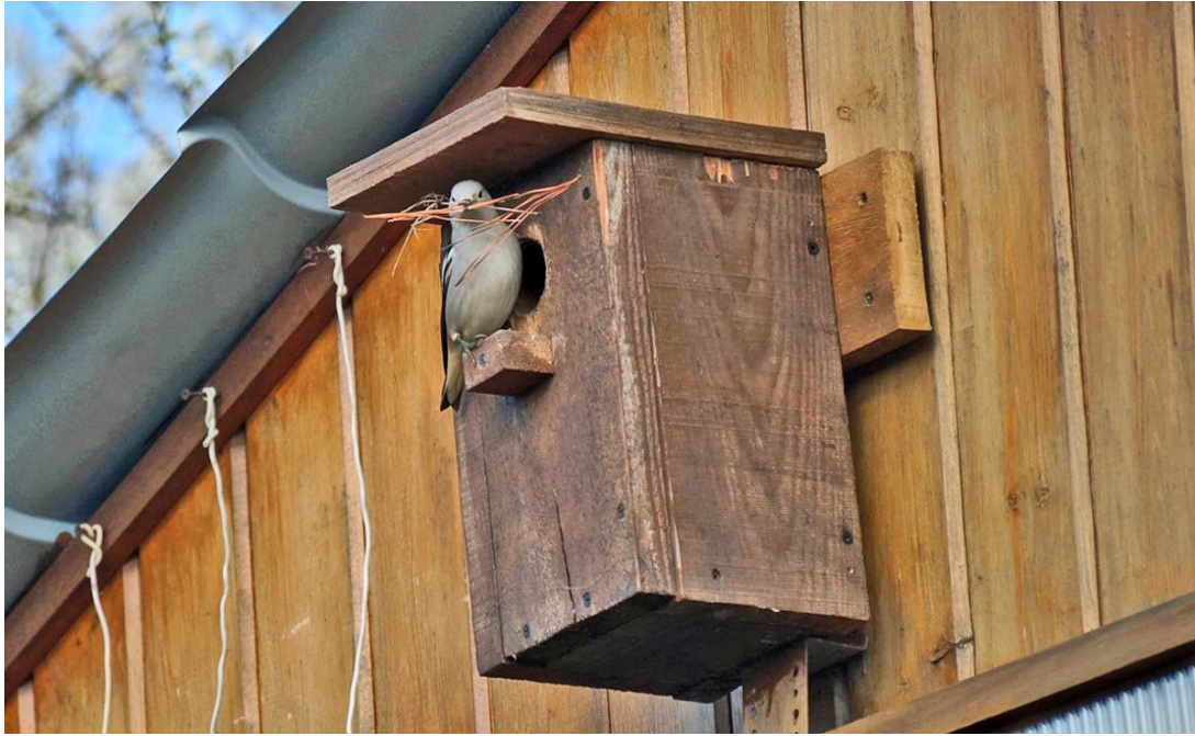
Рис. 5. Самец малого скворца Sturnia sturnina со строительным материалом для гнезда. Надеждинский район, село Сиреневка, 11 мая 2021.