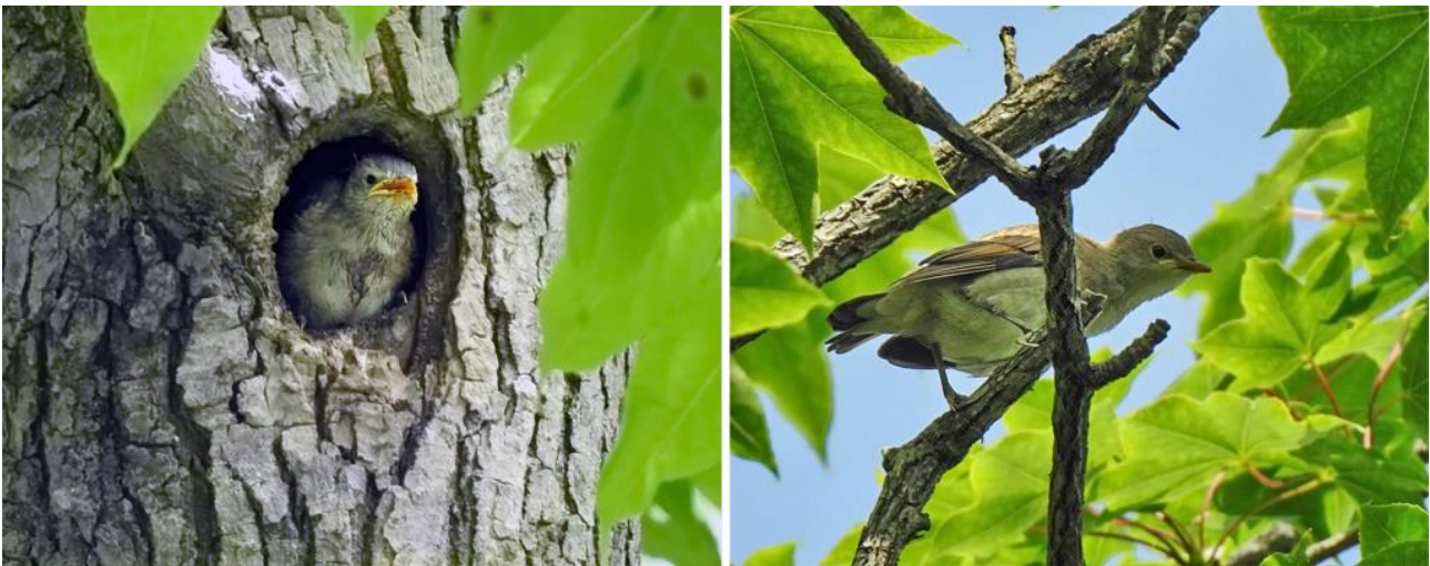
Рис. 13. Слётки малого скворца Sturnia sturnina . Залив Петра Великого, остров Русский, 1 июля 2020.

Во второй половине июня птенцы оперяются (табл. 2; рис. 11), и за ними ухаживают оба родителя, принося корм, удаляя капсулы помёта и обновляя подстилку гнезда (рис. 12). Порция пищи, принесённая одним из родителей, содержит от 1 до 5 объектов, при этом за один прилёт корм получает один, реже два птенца (Лаптев 1984).