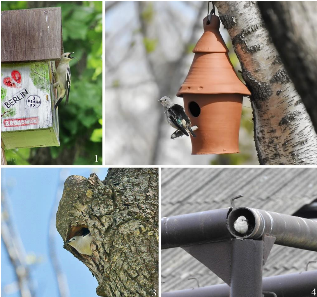
Рис. 6. Некоторые варианты размещения гнёзд малого скворца Sturnia sturnina . 1 – залив Петра Великого, остров Русский, 16 июня 2017; 2 – там же, 11 мая 2020; 3 – там же, 21 мая 2019; 4 – залив Петра Великого, остров Путятина, 17 июня 2018