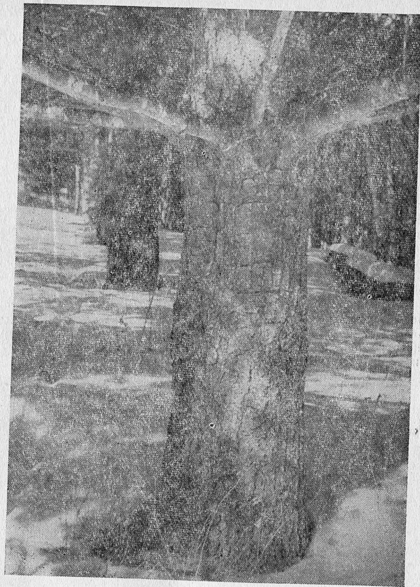
Рис. 4. Ствол веймутовой сосны с трещиноватой пластинчатой корой

Ряд ученых М. Л. Рева (1964), Н. Р. Письменный (1964), Н. К. Вехов и В. Н. Вехов (1962), — отмечают, что грибным заболеваниям веймутова сосна чаще подвергается в чистых насаждениях и в зрелом возрасте. Поэтому в целях недопущения по-