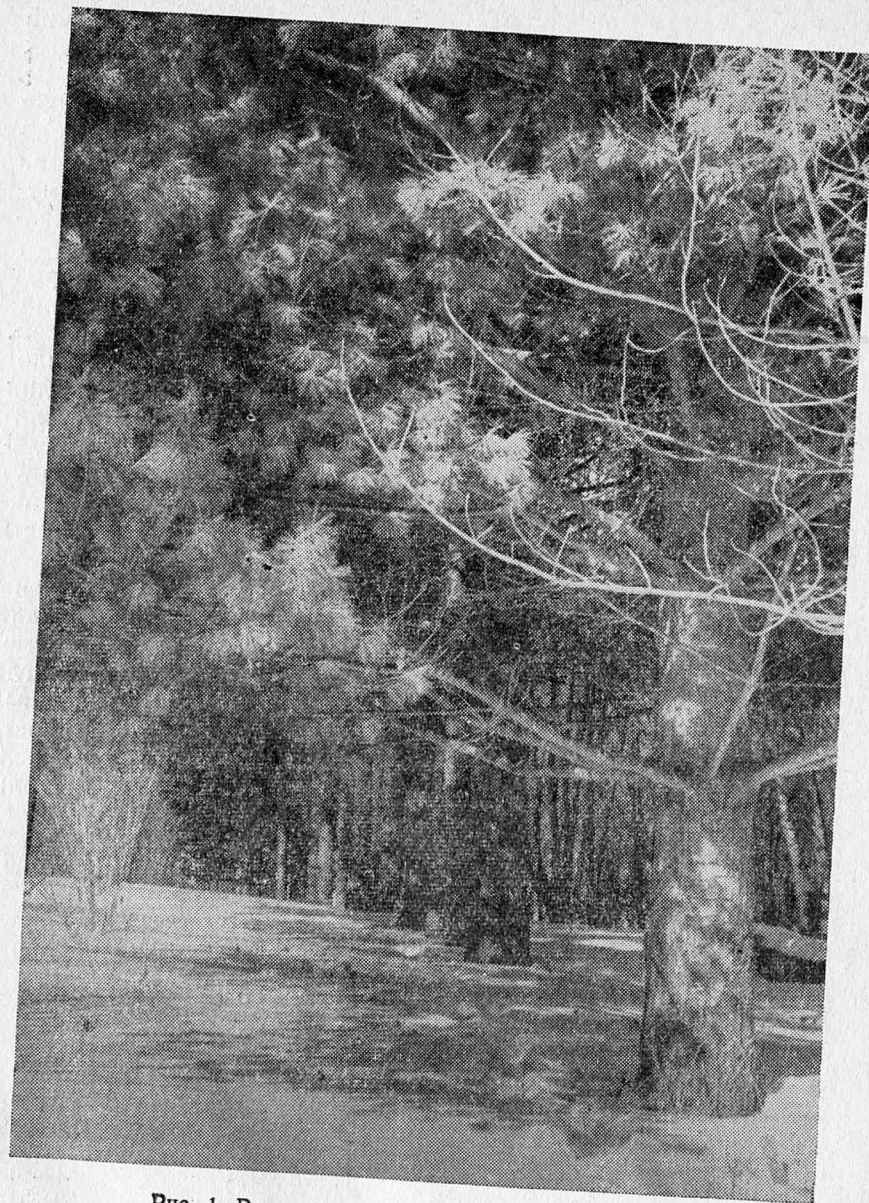
Рис. 1. Ряд веймутовой сосны в дендрарии

Посадка саженцев веймутовой сосны проведена в один ряд, на расстоянии 1,5 м друг от друга в ряду (рис. 1) с расположением ряда с запада на восток. Продолжением посадок веймутовой сосны были: на запад посадки пихты цельнолистной ( Abies holophylla Maxim.), а на восток — сосны обыкновенной и черной ( Pinus silvestris L. и P. nigra Arn.). С южной и северной сторон, на расстоянии 3 м были посажены рядами различные