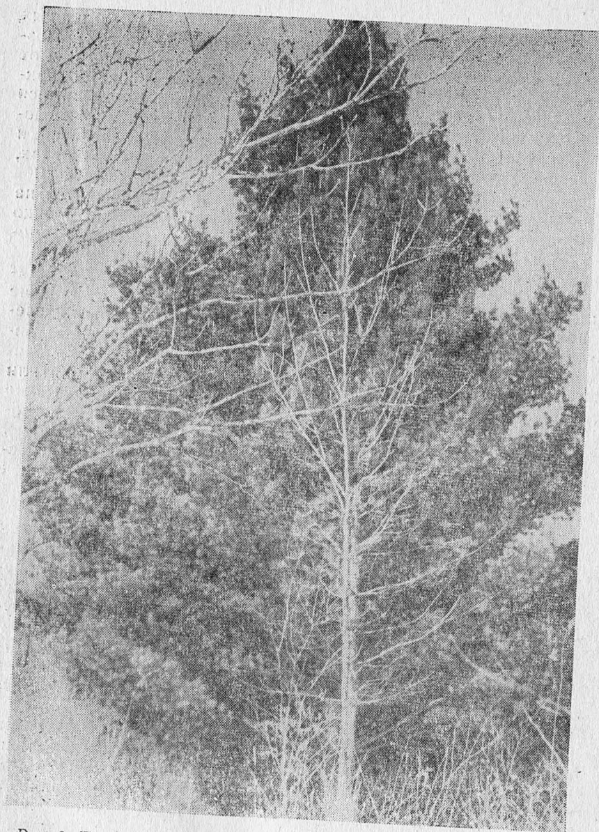
Рис. 2. Пирамидальная крона молодого дерева веймутовой сосны

Первые женские шишечки появились на деревьях на 14 году жизни, а мужские на год позже. В 20 лет веймутова сосна начала обильно плодоносить и давать всхожие семена.