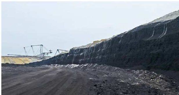
Рис. 1. Выходы пласта «Мощный», Назаровский угольный разрез Канско-Ачинский бассейн, Красноярский край.