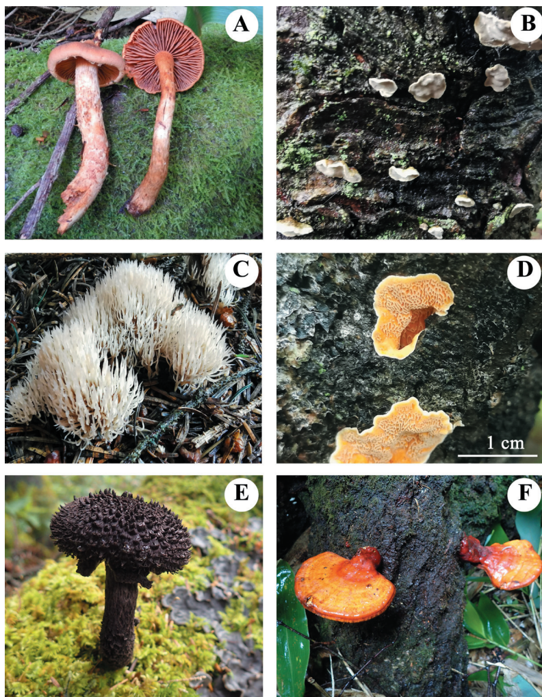
Рис. 2. Плодовые тела базидиальных грибов в природе: А – Cortinarius rubellus (ABGI 2336/170111); В – Aleurocystidiellum subcruentatum (VLA M-28318); С – Pterula multifida (VLA M-28307); D – Steccherinum aurantilaetum (VLA M-28226); E – Strobilomyces strobilaceus (ABGI 2286/170168); F – Ganoderma lucidum (VLA M-28249) [Fig. 2. Basidiocarps of basidial fungi in nature: A – Cortinarius rubellus (ABGI 2336/170111); B – Aleurocystidiellum subcruentatum (VLA M-28318); C – Pterula multifida (VLA M-28307); D – Steccherinum aurantilaetum (VLA M-28226); E – Strobilomyces strobilaceus (ABGI 2286/170168); F – Ganoderma lucidum (VLA M-28249)].

и др.), а на хвойных – четыре вида ( Laetiporus montanus Černý ex Tomšovský et Jankovský, Phaeolus schweinitzii (Fr.) Pat., Phellinus hartigii (Allesch. et