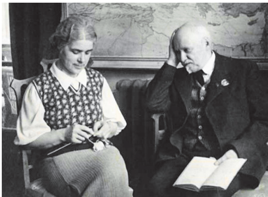
Надежда Викторовна и Владимир Леонтьевич Комаровы, 1941 г.