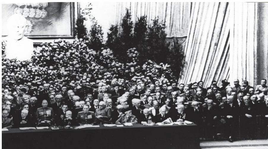
Президиум торжественного заседания юбилейной сессии, состоявшейся в Большом театре Союза СССР 16 июня 1945 г. [АРАН. Р.IX. Оп. 2. Д. 14 и Оп. 4. Д. 44]

служения народу и в горячей благодарности нашему Правительству, так много сделавшему для развития науки и так высоко поднявшему значение Академии...» [АРАН. Ф. 277. Оп. 4. Д. 1615. Л. 23].