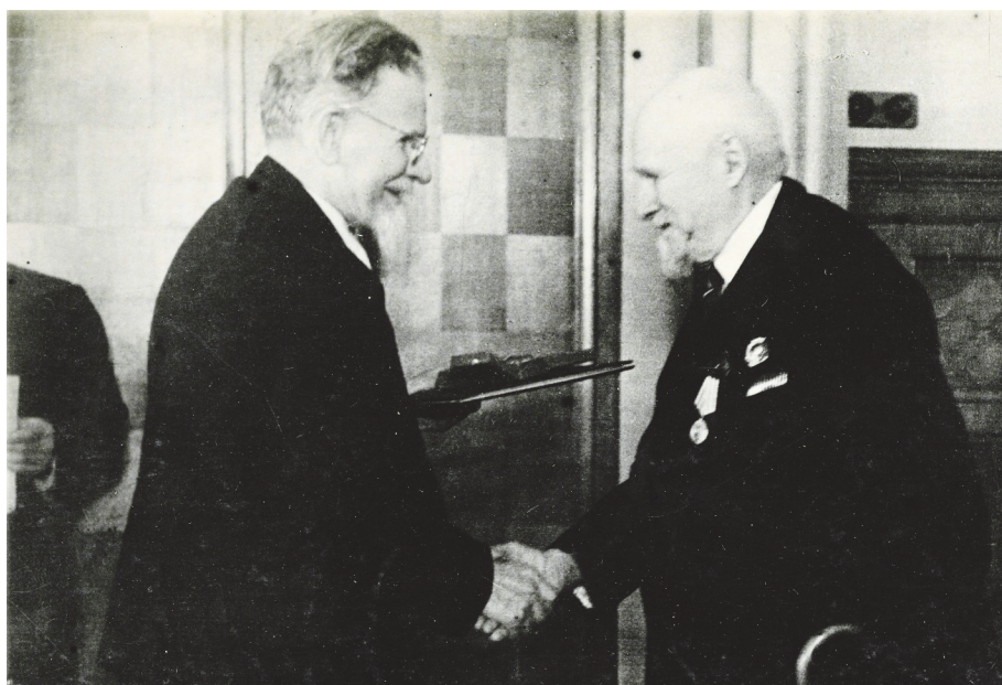
Председатель Президиума Верховного Совета СССР М.И. Калинин вручает награду академику В.Л. Комарову, 1944 г. [АРАН. Ф. 277. Оп. 6. Д. 39. Л. 1]

Социалистического труда с вручением ордена Ленина и золотой медали «Серп и молот». Поздравлений было много. Вот, например, текст из поздравительного адреса сотрудников Института Кристаллографии: «В своё время Вы были одним из первых, поддержавших правильную мысль о необходимости организации самостоятельной Лаборатории Кристаллографии. Ваш веский голос в этом вопросе оказался тогда решающим и предопределил, в значительной степени, дальнейшее развитие Лаборатории, которая с гордостью носит теперь имя Института...» [АРАН. Ф. 277. Оп. 2. Д. 82. Л. 2].