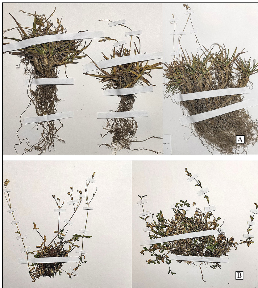
Рис. 2. Фрагменты гербарных образцов Poa sugawarae (A) и Cerastium sugawarae (B) в поздней фазе развития из locus classicus : “Сахалин, Сусунайский хребет, седловина между горами Высокая и Майорская, 46°54′39.5″ с. ш., 142°55′20.7″ в. д., на серпентинитовой осыпи, 14 IX 2021, В.В. Шейко” (VLA).

Fig. 2. Fragments of herbarium specimens of Poa sugawarae (A) and Cerastium sugawarae (B) at the late stage of development from type localities: “Sakhalin, Susunay Ridge, saddle between Vysokaya Mt. and Mayorskaya Mt., 46°54′39.5″ N, 142°55′20.7″ E on serpentinite scree, 14 IX 2021, V.V. Sheiko” (VLA).