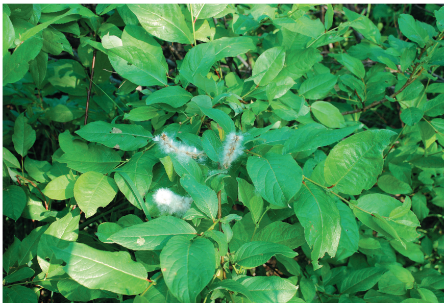
Рис. 3. Ветка Salix farriae с плодущими женскими серёжками [ Fig. 3. Branch of Salix farriae with fertile female catkins].

Salix farriae описан из Сев. Америки: «Rocky Mts. of southern Alta. and B. C. and northern Mont.» (Ball, 1921) и распространён в горах на северо-западе этого континента. Вид относится к секции Hastatae (Fr.) A. Kerner (Argus, 2010). В этой секции насчитывается 12–15 (Скворцов, 1968) или 24 вида (Argus, 2010), распространённых в Голарктике, большая часть их – в Сев. Америке (17 видов). Во флоре российского Дальнего Востока к ней относятся только два вида – Salix hastata L. и S. pyrolifolia Ledeb. (Недолужко, 1995)