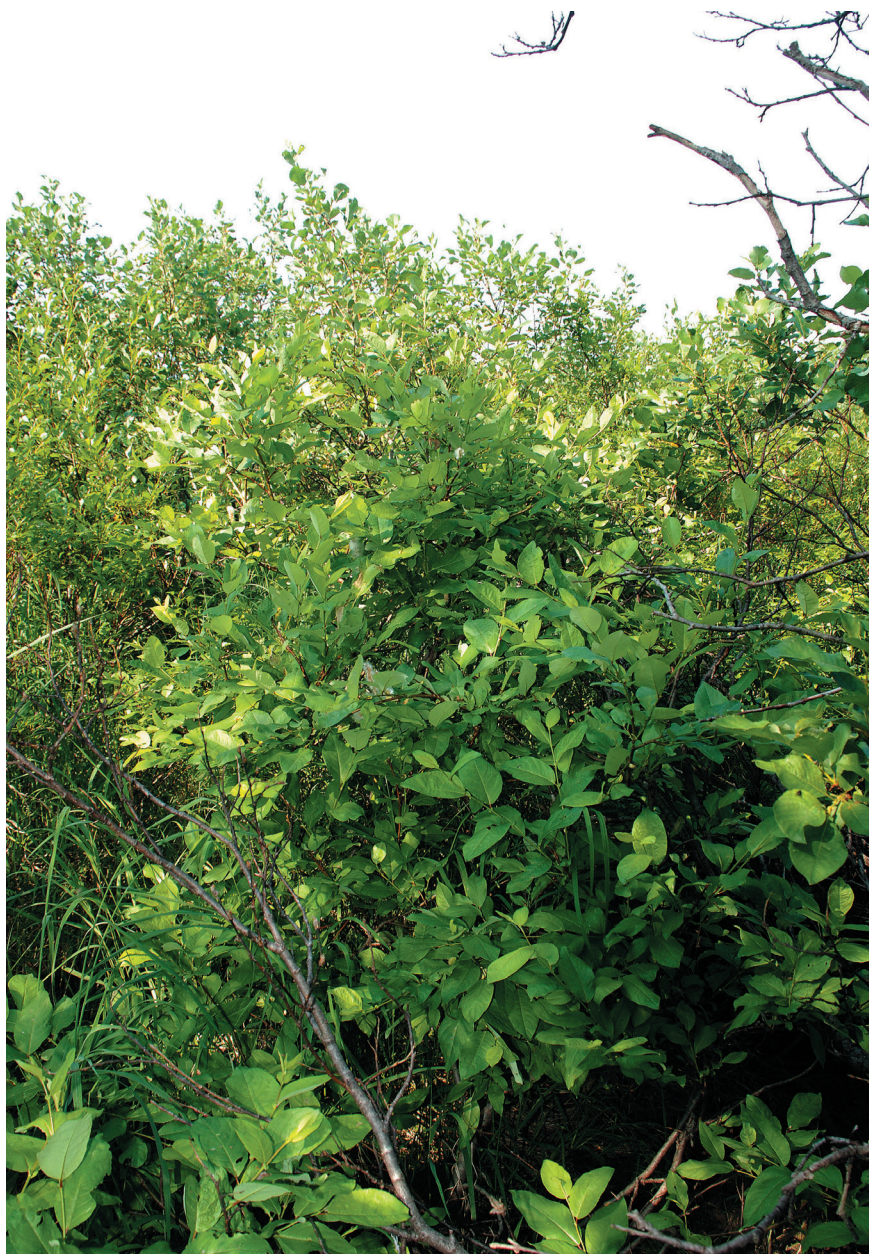
Рис. 4. Заросли кустарниковых ив с Salix farriae в пойме р. Лэнгвырэнваям (Камчатка) [ Fig. 4. Thickets of shrub willows with Salix farriae in the floodplain of the Langvyurenvayam River (Kamchatka)].