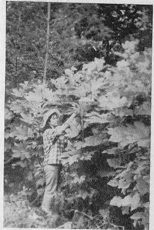
Рис. 1. Filipendula kamtschatica в тургесцентном состоянии

Цель наших исследований — получить объективный материал для сравнительной характеристики отдельных элементов водного режима основных представителей крупнотравья: лабазника камчатского — Filipendula kamtschatica (Trin.) Maxim., борщевика сладкого — Heraclium dulce Fisch., крестовника коноплево-