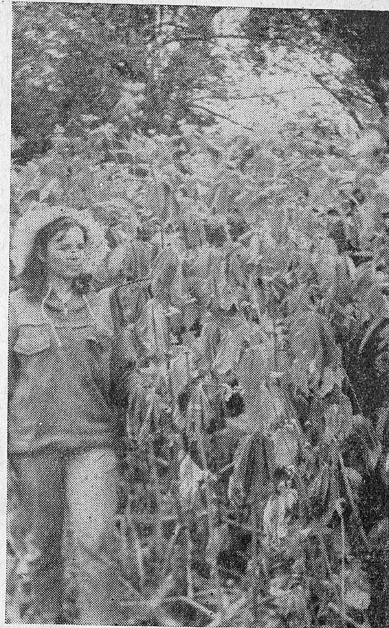
Рис. 2. Filipendula kamschatica в период засухи (полная потеря тургора).

В начале вегетации на сухих участках в ассимилирующих органах шеломайника недостаток насыщения составил в утренние часы 6,64%, в полуденные — 7,30%. В дальнейшем он увеличивается, достигая 18—19 июля максимального значения — 39,4% (1970). Самые большие величины водного дефицита найдены в этот день в листьях крестовника. Если в начале вегетации недостаток насыщения находился в пределах 5,15—8,80%, то во второй половине июля водный дефицит достигает максимального значения — 47,6%. При этом листья крестовника, несмотря на очень большую потерю воды, в вечерние часы восстанавливали свой тургор, листья же шеломайника погибали (рис. 2). Величина полуденного водного дефицита в листьях борщевика в этот день была 19,6%, а утром следующего дня — 3,06% (рис. 3). В условиях влажного варианта у исследуемых видов были обнаружены более низкие значения водного дефицита. Наибольший водный дефицит в полуденные часы составлял