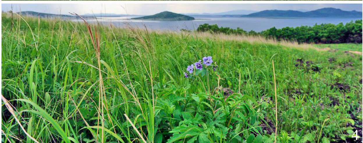
Рис. 3. Типичные варианты гнездовых биотопов ошейниковых овсянок Emberiza fucata в прибрежных районах Приморского края. 1 – Хасанский муниципальный округ, Голубиный Утёс, 19 мая 2023, фото Д.В.Коробова; 2 – там же, окрестности посёлка Зарубино, 28 июля 2023, фото Ю.Н.Глущенко; 3 – залив Петра Великого, остров Русский, 20 июня 2023, фото А.П. Ходакова; 4 – Хасанский муниципальный округ, 1 июня 2016, фото Д.В. Коробова.