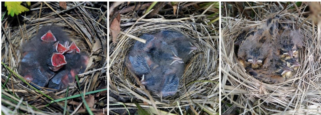
Рис. 13. Гнездовые птенцы ошейниковой овсянки Emberiza fucata . 1 – Спасский район, 14 июня 2012; 2 – окрестности города Артём, 24 июня 2023; 3 – залив Петра Великого, остров Русский, 20 июня 2023

Птенцы из одной кладки выходят из яиц неодновременно, и этот процесс может растягиваться на 2 сут. В бассейне реки Бикин вылупление птенцов в 9 случаях произошло во второй (8) и в третьей (1) десятидневках июня (Пукинский 2003).