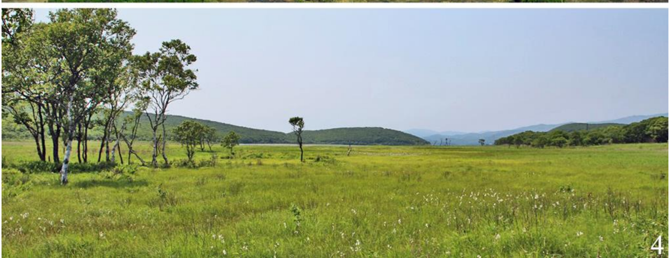
Рис. 2. Типичные варианты гнездовых биотопов ошейниковых овсянок Emberiza fucata во внутренних районах Приморского края. 1 – окрестности города Артём, 17 июня 2023; 2,3 – Приханкайская низменность, 23 мая 2013; 4 – Лазовский район, 2 июля 2014.