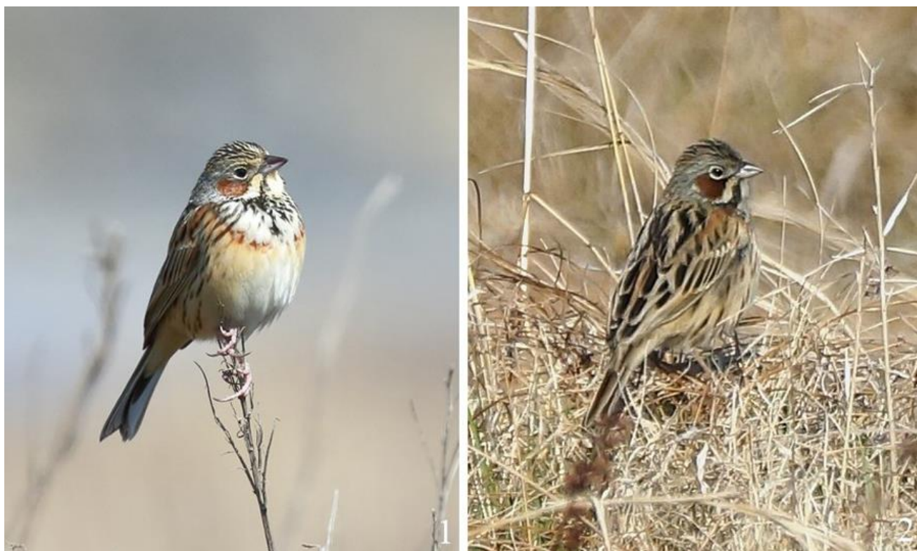
Рис. 4. Передовые пролётные особи ошейниковой овсянки Emberiza fucata . Залив Петра Великого, остров Русский. 1 – 26 апреля 2021; 2 – 28 апреля 2021

В районе залива Восток миграции проходят во второй половине апреля и в мае (Нечаев 2014). На острова залива Петра Великого ошейниковые овсянки прилетают во второй половине апреля (Лабзюк и др. 1971).