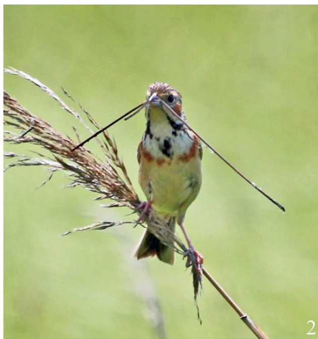
Рис. 6. Самцы ошейниковой овсянки Emberiza fucata , собирающие материал, пригодный для строительства гнезда. 1 – окрестности Владивостока, 12 июня 2019, фото И.А.Малькиной; 2 – Лазовский район, окрестности посёлка Преображение, 2 июля 2014, фото В.П.Шохрина

По данным Е.П.Спангенберга (1940), на реке Большая Уссурка гнёзда ошейниковых овсянок располагались на кочках среди болота или в