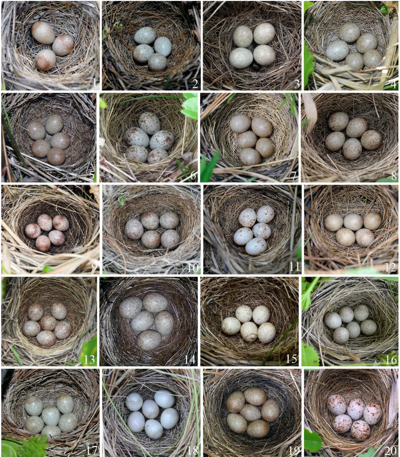
Рис. 11. Варианты окраски яиц ошейниковых овсянок Emberiza fucata в Приморском крае.

1 – Хасанский муниципальный округ, окрестности посёлка Хасан, 21 мая 2014; 2 – там же, окрестности посёлка Зарубино, 10 июля 2014, фото Д.В.Коробова; 3 – залив Петра Великого, остров Путятина, 13 июня 2010, фото Е.В.Кармазиной; 4 – окрестности Владивостока, 22 июня 2014; 5 – там же, 2 июля 2012, фото А.В.Вякова; 6 – окрестности посёлка Хасан, 19 июня 2015, фото Ю.Н.Глушенко; 7 – там же, 23 мая 2014; 8 – там же, 10 июня 2023; 9 – залив Петра Великого, бухта Мраморная, 5 июня 2016; 10 – там же, остров Попова, 5 июня 2012; 11 – окрестности посёлка Хасан, 23 мая 2014; 12 – окрестности посёлка Зарубино, 9 июня 2014, фото Д.В.Коробова; 13 – 7 июня 2014, окрестности посёлка Хасан, фото Н.Н.Балацкого; 14 – залив Петра Великого, остров Русский, 7 июня 2019, фото А.П.Ходакова; 15 – 5 июля 2012, Лазовский район, окрестности посёлка Преображение, фото В.П.Шохрина; 16 – окрестности посёлка Хасан, 5 июня 2015; 17 – там же, 27 июня 2013; 18 – там же, 15 июня 2014, фото А.В.Вякова; 19 – окрестности города Артём, 17 июня 2023, фото А.П.Ходакова; 20 – окрестности посёлка Хасан, 28 июня 2004, фото Н.Н.Балацкого.