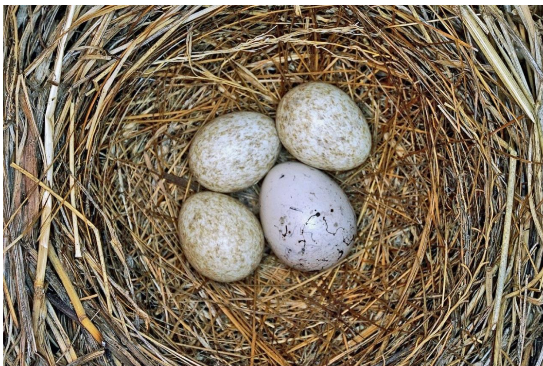
Рис. 15. Кладка ошейниковой овсянки Emberiza fucata с яйцом обыкновенной кукушки Cuculus canorus . Окрестности посёлка Хасан. 28 июня 1992.

середине июля. Овсянки склёвывали многочисленных бабочек в высоких зарослях травы в июле. Наибольшая встречаемость этой группы в питании – утром и вечером, когда бабочки находились в состоянии покоя и поэтому становились лёгкой добычей для птиц. Со второй половины июля по август в пище птенцов доминировали прямокрылые. С третьей декады июля пищей овсянок, охотящихся в густой растительности по склонам сопок, часто становились жесткокрылые. В это время их встречаемость в пробах пищи возрастала до 97% и не зависела от погоды и времени суток. Овсянки, вероятно, специально не охотились за равнокрылыми и перепончатокрылыми из-за того, что их трудно поймать в воздухе. Поэтому эти насекомые составляли не более 3.3% пищи.