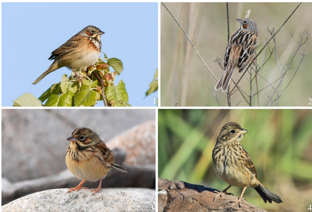
Рис. 1. Ошейниковые овсянки Emberiza fucata . 1 – самец, залив Петра Великого, бухта Спасения, 13 мая 2015; 2 – самец, там же, остров Попова, 28 мая 2011; 3 – самка, там же, остров Большой Пелис, 16 мая 2012; 4 – молодая птица, там же, остров Попова, 22 июля 2007.

виды биотопов и были самыми многочисленными птицами. На склонах сопок и болотистых лугах их обилие составляло 115.8-200 пар/км 2 , а на сухих низкотравных лугах – 40 пар/км 2 (Назаров, Казыханова 1974; Назаров и др. 1979).