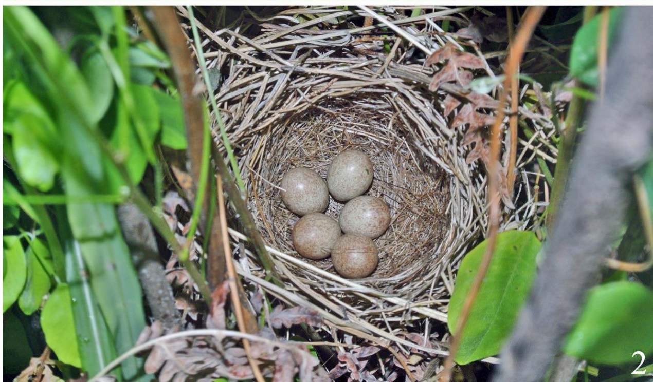
Рис. 9. Некоторые варианты расположения гнёзд ошейниковой овсянки Emberiza fucata на древесных растениях. Хасанский муниципальный округ, окрестности посёлка Хасан. 27 июня 2013.

По нашим данным, гнездо состоит из трёх частей. Лоток выстилается тонкими (0.3-2.0 мм) средней длины (до 180 мм) сухими стеблями злаков, листьями осок и тростника, корешками Geranium vlassovianum , Ly-