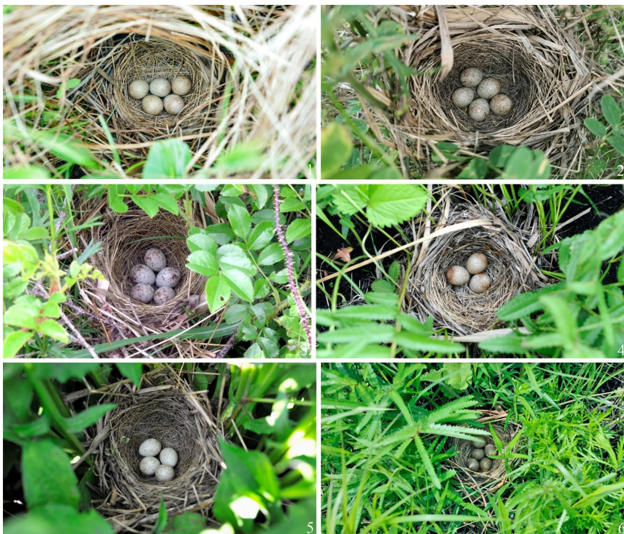
Рис. 8. Некоторые варианты расположения гнёзд ошейниковой овсянки Emberiza fucata в Приморском крае на земле: 1 – Хасанский муниципальный округ, окрестности посёлка Зарубино, 9 июня 2014; 2 – там же, окрестности посёлка Хасан, 10 июня 2023, фото Д.В.Коробова; 3 – там же, 19 июня 2015, фото Ю.Н.Глущенко; 4 – там же, 21 мая 2014; 5 – там же, окрестности посёлка Зарубино, 10 июля 2013; 6 – там же, окрестности посёлка Хасан, 23 мая 2014, фото Д.В.Коробова

Некоторые типичные варианты расположения гнёзд на земле и на древесных растениях иллюстрируют рисунки 8 и 9.