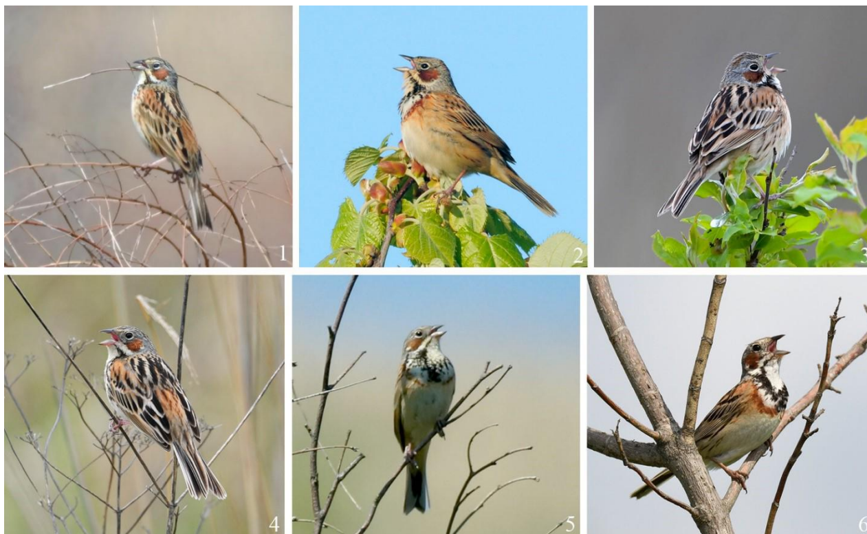
Рис. 5. Поющие ошейниковые овсянки Emberiza fucata . 1 – залив Петра Великого, остров Русский, 29 апреля 2022; 2 – там же, полуостров Гамова, 13 мая 2015; 3 – там же, остров Попова, 16 мая 2021; 4 – там же, 28 мая 2011; 5 – там же, остров Русский, 29 мая 2020; 6 – окрестности Владивостока, 30 июля 2017

Гнездование. Песенную активность самцы проявляют с момента их прилёта и продолжают петь до конца июля, а в отдельных случаях они подают голос и в первой декаде августа (Панов 1973; наши данные). Птицы исполняют песни, сидя на вершине куста, длинной травинке, реже на дереве (рис. 5).