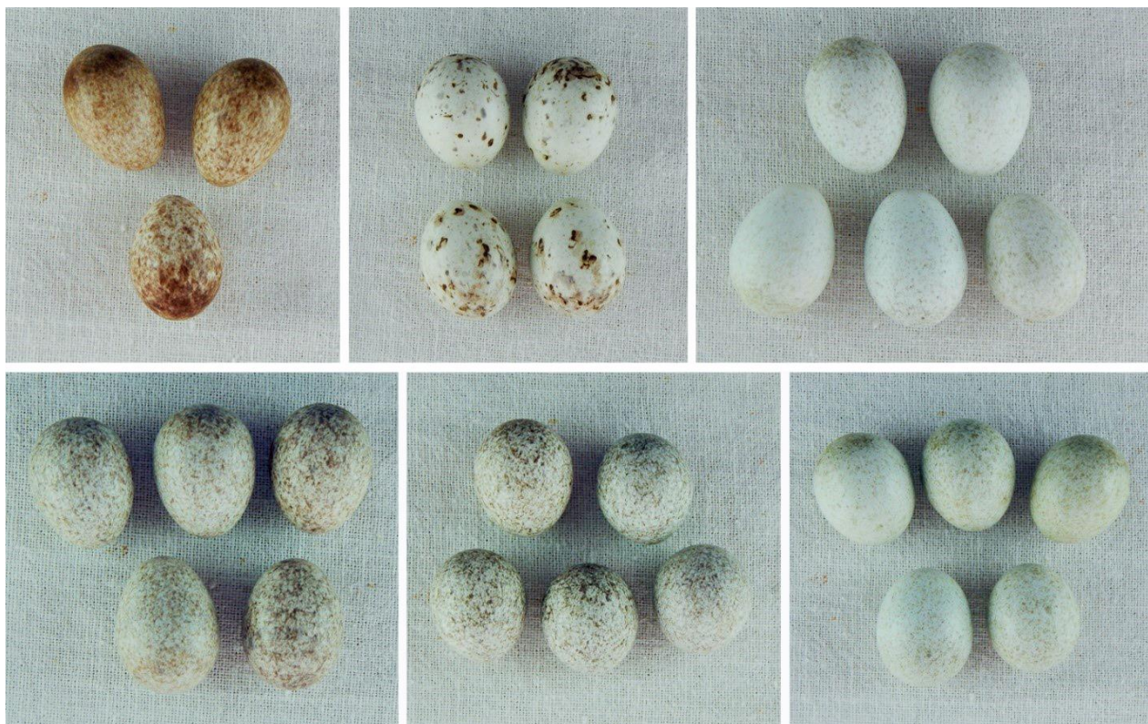
Рис. 12. Варианты окраски яиц ошейниковых овсянок Emberiza fucata в Приморском крае. Студийная съёмка кладок из оологической коллекции В.Н.Сотникова (город Киров)

оливково-коричневый, рыжевато-коричневый, либо бурый. Пятна поверхностные и глубинные, распределены равномерно по поверхности или сгущаются на тупом конце, где образуют венчик. Линии поверхностные, равномерно распределённые. Плотность пятен от редкой до густой, а линий – редкая. Нередко одно яйцо в кладке имеет более тёмный фон, чем остальные и меньшее количество отметин, или цвет яйца светлее и вокруг широкого конца образуется кольцо из пятен. Для наглядности приводим коллажи, составленные из фотографий разных кладок ошейниковой овсянки из Приморского края, выполненных в условиях природы (рис. 11) и в коллекции (рис. 12).