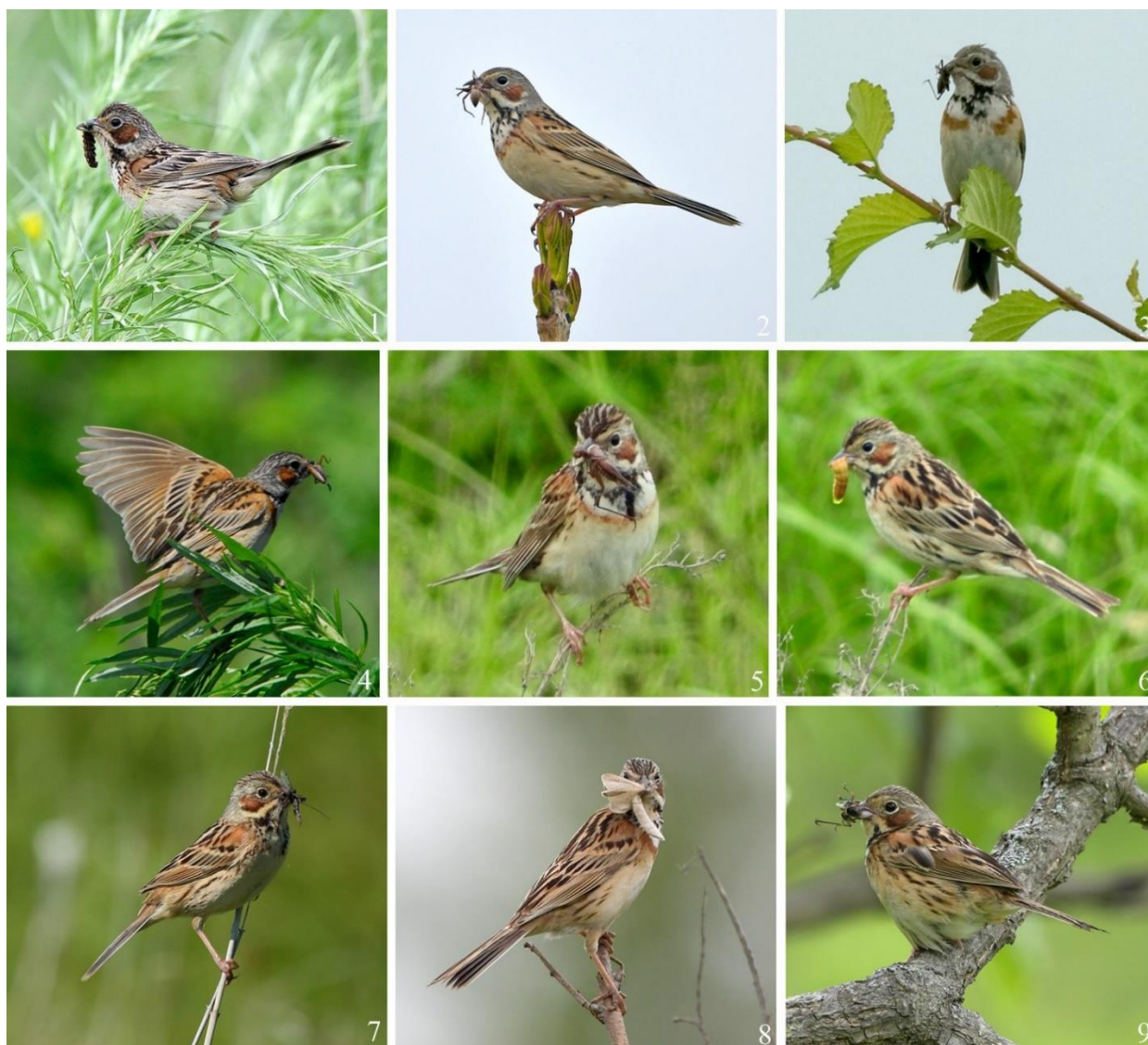
Рис. 14. Ошейниковые овсянки Emberiza fucata с кормом для птенцов.

При наблюдении на гнездовых участках, приносимый птенцам корм включал преимущественно различных насекомых и их личинок, реже пауков (рис. 14).