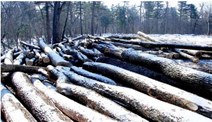
Рис 1. Верхний склад возле границы Уссурийского заповедника. Урочище Большая Барсуковка. 20.03.2008 г.

В работе приведены некоторые сведения и результаты наблюдений за распределением и