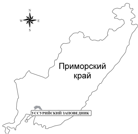
Рисунок 1 – Географическое положение заповедника «Уссурийский» ДВО РАН

Отряд Lagougrpha – Зайцевые: заяц маньчжурский – Lepus mandshuricus Redde, заяц-беляк – L. timidus (L.) (сем. Зайцевые – Leporidae). Отряд Rodentia – Грызуны: белка обыкновенная – Sciurus vulgaris (L.), бурундук азиатский – Tamias sibiricus (Laxm.) (сем. Белычьи – Sciuridae). Отряд Carnivora – Хищные: лисица обыкновенная – Vulpes vulpes (L.), собака енотовидная – Nyctereutes procyonoides (Gray) (сем. Собачьи – Canidae); медведь бурый – Ursus arctos (L.), медведь белогрудый – U. thibetanus (Cuvier) (сем. Медвежьи – Ursidae); ласка – Mustela nivalis (L.), колонок – M. sibirica (Pall.), норка американская – M. vison (Shreber), барсук азиатский – Meles leucurus Hodgs., выдра речная – Lutra lutra (L.), харза – Martes flavigula (Bodd.), соболь – M. zibellina (L.) (сем. Кунице-вые – Mustelidae); кот амурский – Prionailurus euphilura Elliot., рысь обыкновенная – Lynx lynx (L.), тигр – Panthera tigris (L.) (сем. Кошачьи – Felidae). Отряд Artiodactyla – Парнокопытные: кабан – Sus scrofa (L.) (сем. Свиные – Suidae), изюбрь – Cervus elaphus (L.), олень пятнистый – C. nippon (Temm.), косуля сибирская – Capreolus