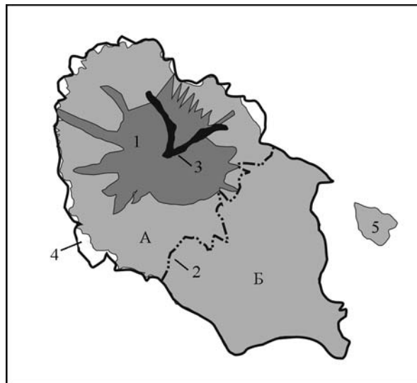
Рис. 3. Основные ландшафтные изменения в результате извержения 2009 г.

Потоки сопровождалась раскаленными пирокластическими волнами. Если первые двигались по любым понижениям рельефа, в том числе по ложинам, где ранее прошли лавовые потоки, то волны перемещались по любым поверхностям, включая возвышенные. В результате элементы мезорельефа, как, например, лавовые потоки 1976 г. (в северо-западном секторе), стали видны менее отчетливо; вероятно, их рельеф был частично нивелирован мощными (до нескольких метров) свежими отложениями потоков и волн. Пирокластические потоки полностью погребли растительность на склонах, тогда как газово-песчаные волны обугливали и обдирали стволы ольховника, оставив на ряде склонов обширные массивы мертвых зарослей. Мощность отложений волн, как было изучено недавно на вулкане Шивелуч [9], коррелирует с уровнем разрушительного воздействия. Интенсивный (возможно, неоднократный) термический и меха-